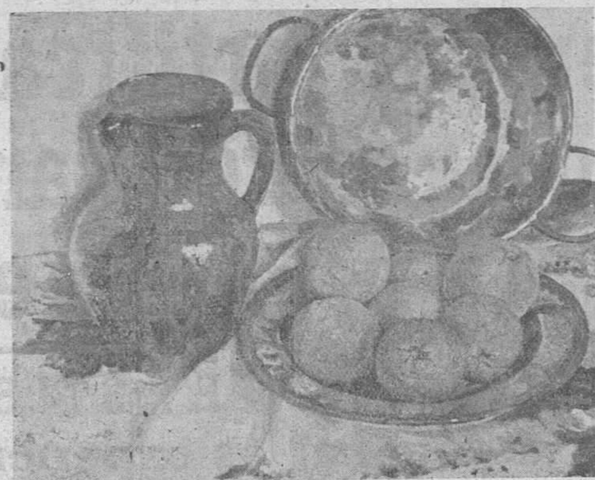
Otra bellísima «Naturaleza muerta», obra de Bedate presentada a la Exposición de Educación y Descanso.