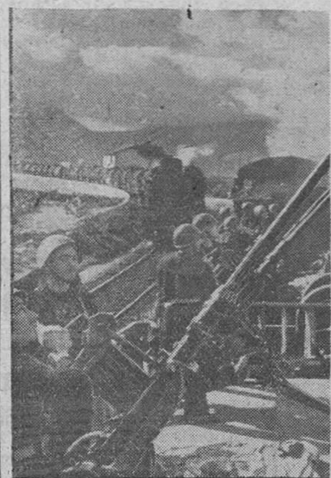
Cañones antiaéreos sobre uno de los trenes blindados que aseguran la costa italiana. Estas piezas están servidas por artilleros de marina

Churchill ha declarado recientemente que, al terminar en Europa, la guerra irá al Oriente. La tragedia del Irán es la de ser encrucijada de los caminos que a él conducen y que han de ser testigos en el futuro de luchas encarnizadas entre las más grandes potencias mundiales. A esta liza gigante no faltará con seguridad: la gran Alemania.