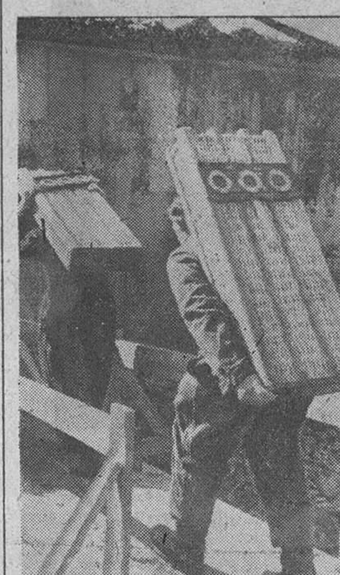
Aprovisionamiento de municiones de uno de los fortines construidos en la costa atlántica por la organización Todt.

una empresa con la que el mando británico perseguiría intenciones operativas de gran envergadura. En todo caso el mando británico estaría obligado a poner en acción un considerable número de sus mejores tropas, las cuales deberían