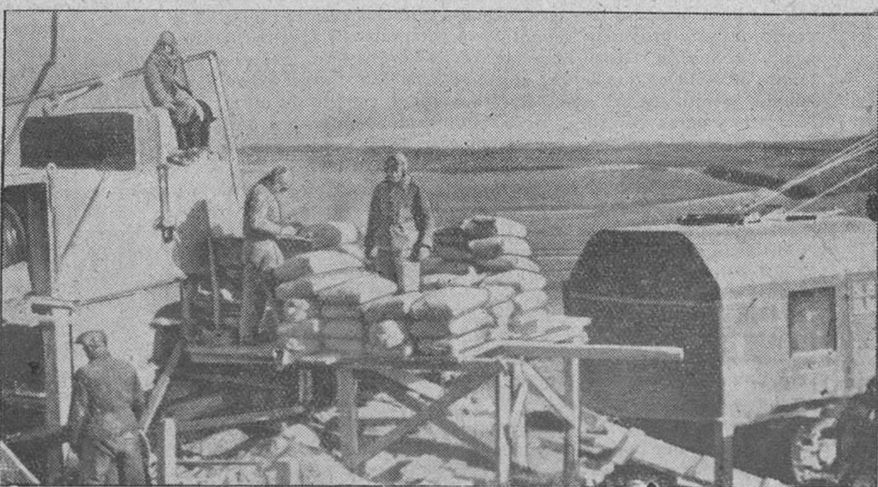
Diariamente se consumieron cantidades astronómicas de cemento en la perfección de la inexpugnable fortaleza en que los soldados alemanes han convertido la costa desde la frontera española al cabo Norte

La defensa alemana prevé todas las variantes imaginables de una invasión inglesa y está cuidadosamente preparada para hacer frente a toda eventualidad, todo lo cual le permite adoptar una actitud de completa tranquilidad frente a los futuros acontecimientos. Los nue-