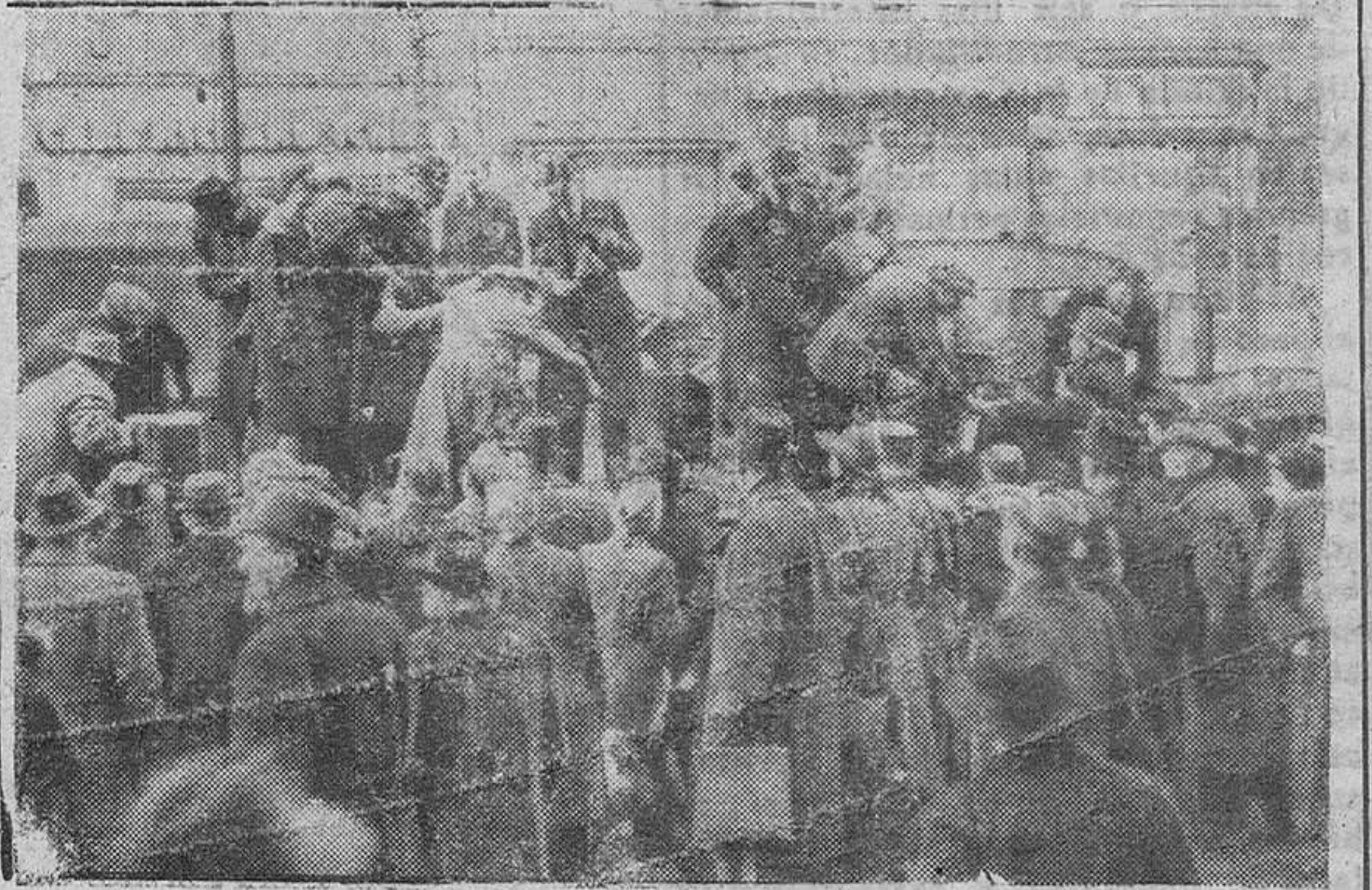
Respondiendo a un llamamiento del Gobierno alemán todos los propietarios de autos y camiones, ponen éstos a disposición de cuantas personas necesitan hacer recorridos largos.