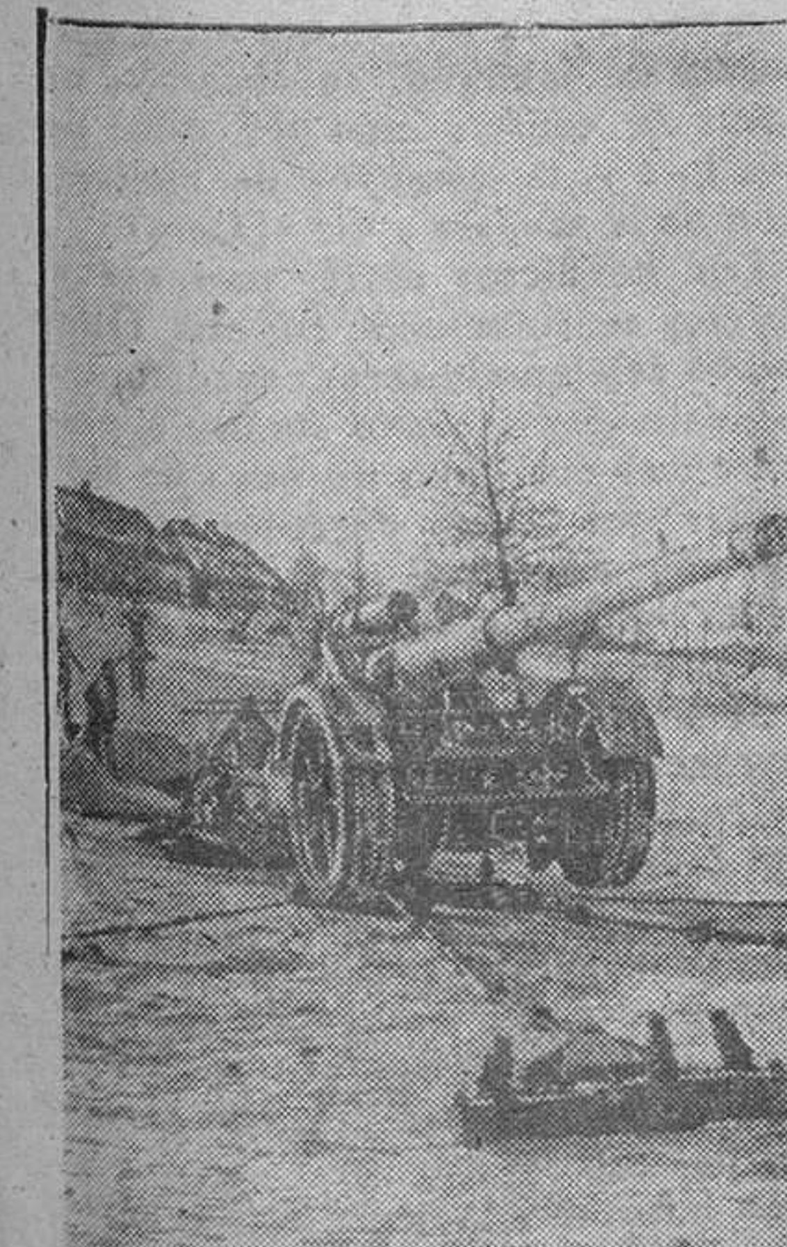
Al sonar la alarma, los servidores de la pieza pesada corren a sus puestos.

La política exterior búlgara no sufrirá modificaciones