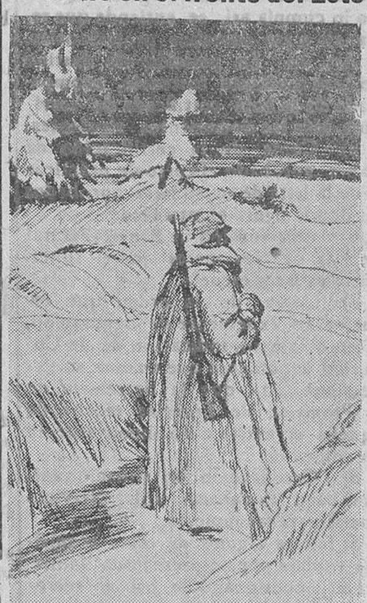
Soldado alemán de vigilancia en un puesto avanzado, visto por un dibujante corresponsal de guerra