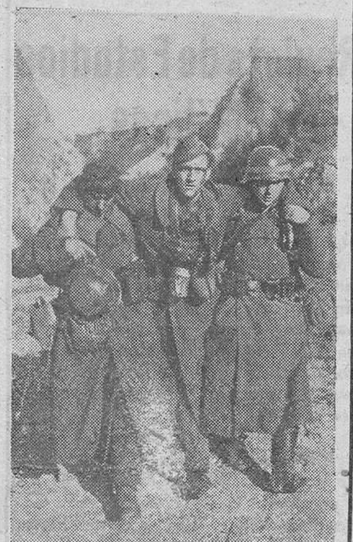
Un soldado germano ha sido herido en la batalla y es recogido por sus camaradas y trasladado al puesto de socorro para su cura