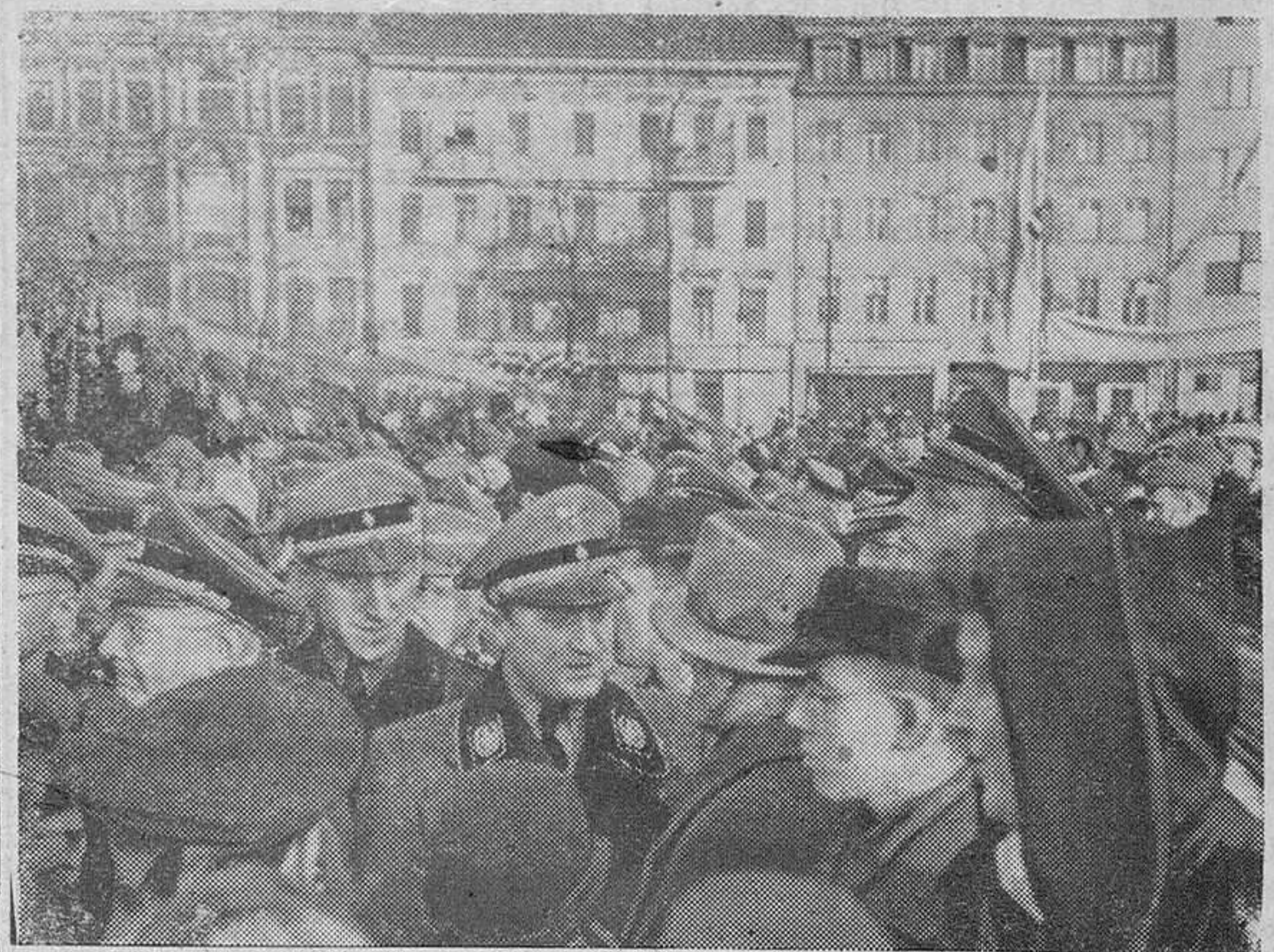
El jefe de las Juventudes alemanas Axmann, asiste a la apertura del gran mercado de Navidad