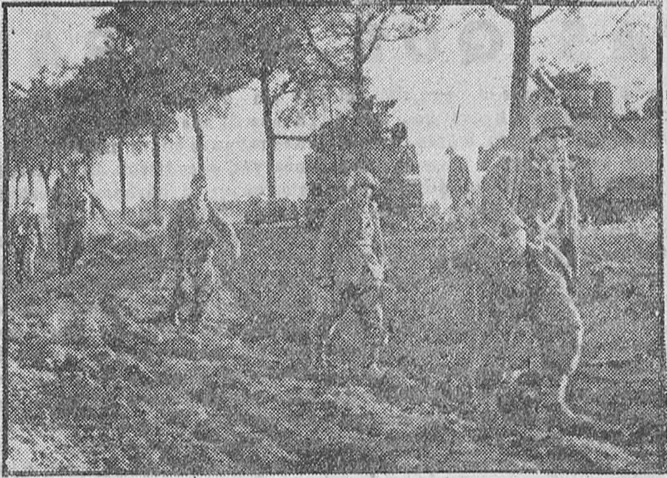
Ante los tanques norteamericanos destruidos, pasan los granaderos alemanes que van a reforzar las primeras líneas del frente oriental.