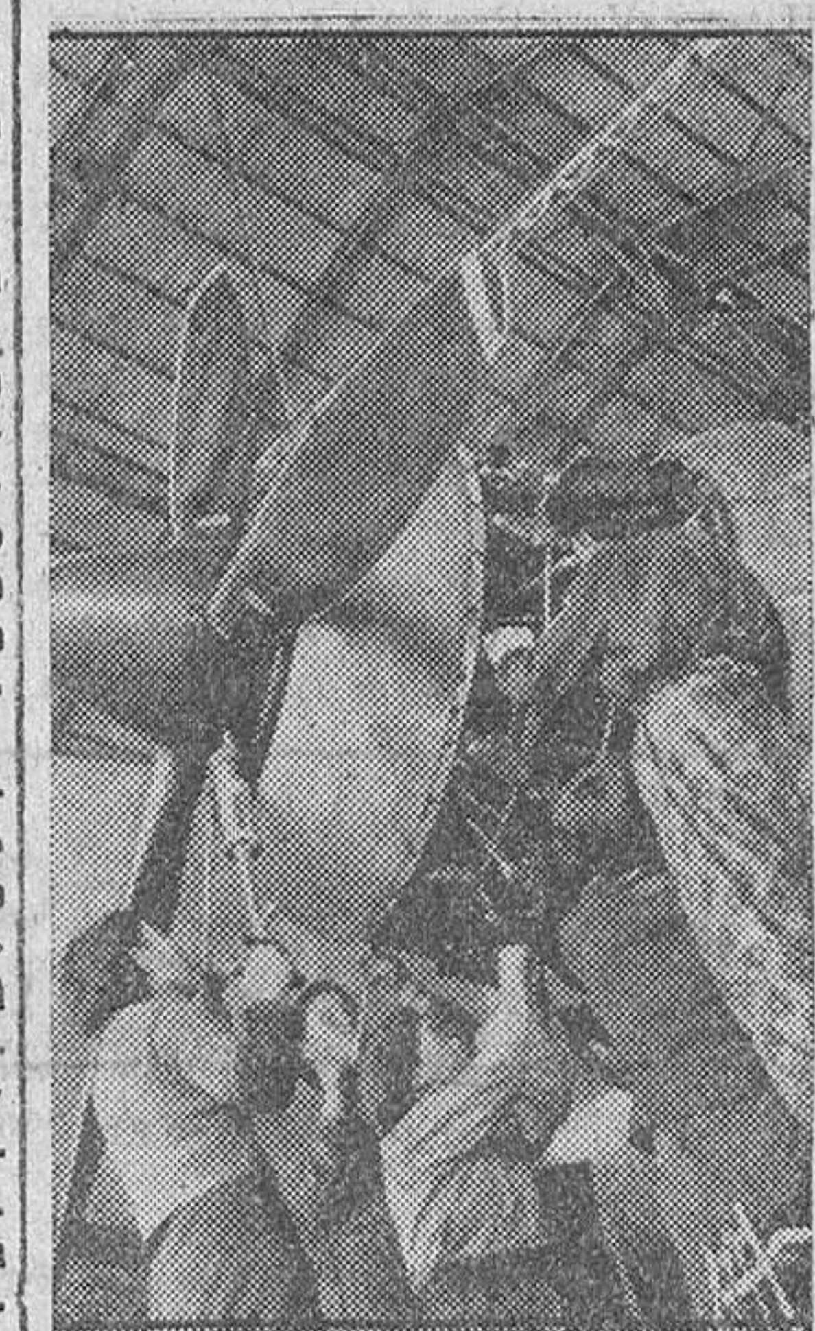
Para aumentar la producción de guerra la mujer japonesa trabaja con todo entusiasmo en las grandes fábricas