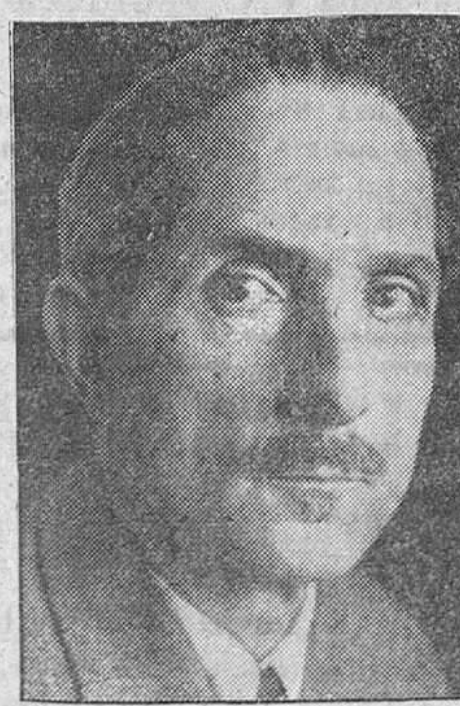
Jakob Schaffner, uno de los más conocidos escritores modernos alemanes, que ha fallecido en Estrasburgo víctima de un bombardeo aéreo.