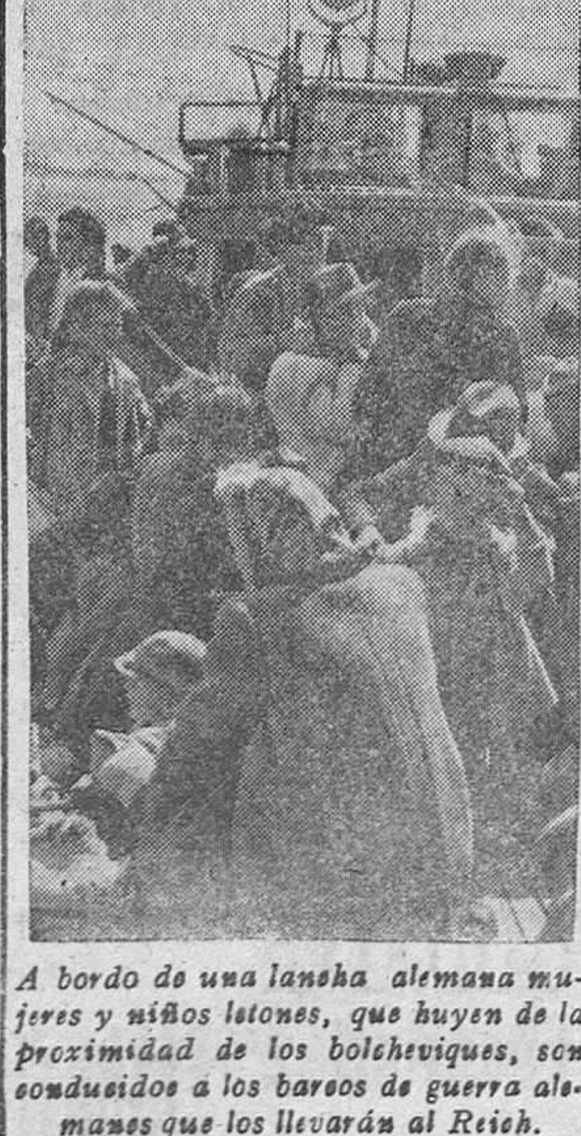
A bordo de una lancha alemana mujeres y niños letones, que huyen de la proximidad de los bolcheviques, son conducidos a los barcos de guerra alemanes que los llevarán al Reich.