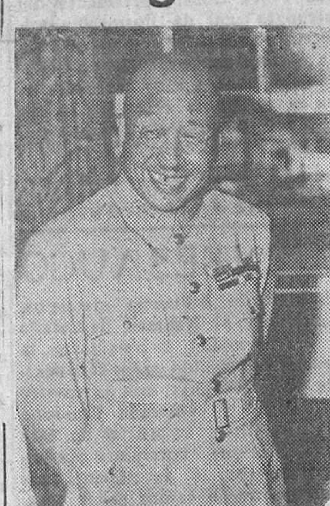
El general Shang Chen, jefe de la misión militar china en los EE. UU.

Los norteamericanos penetraron anoche en las calles de la ciudad, afirma Réuter