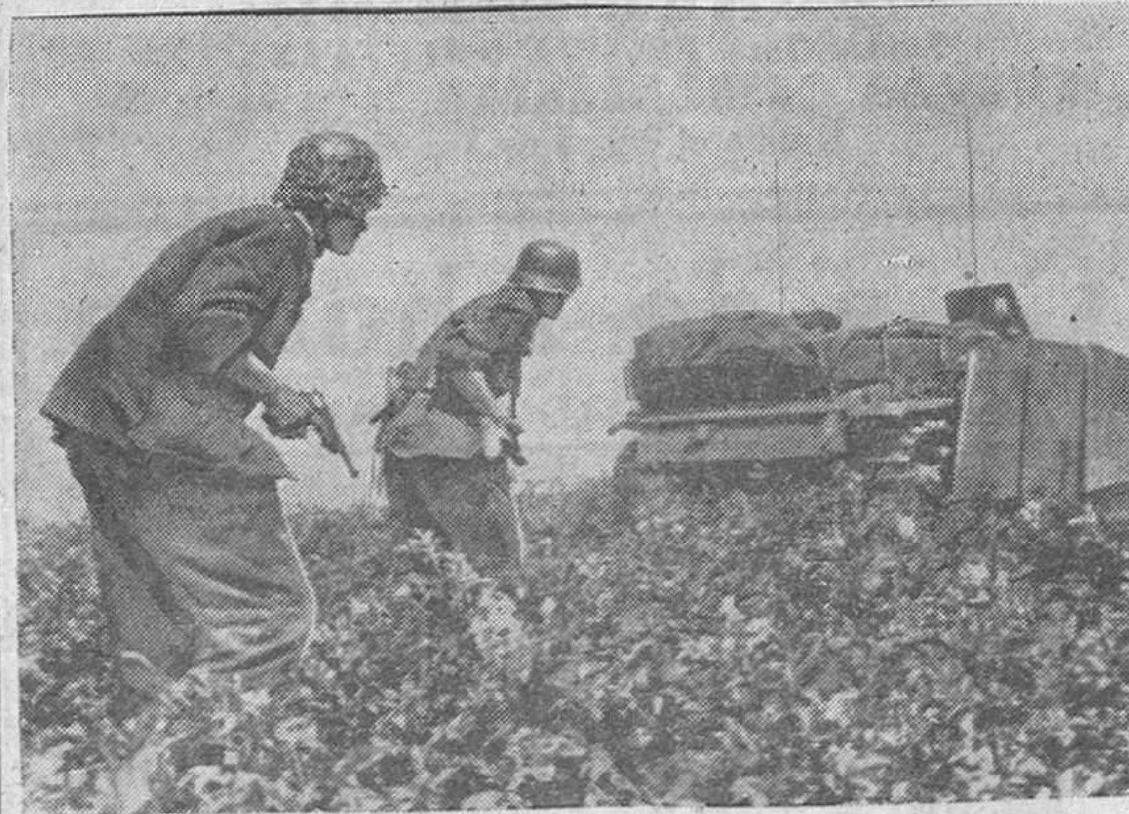
Granaderos alemanes, protegidos por carros de asalto se aproximan en contraataque a las líneas rusas cercanas a la capital polaca. (INFORMACION DE LA GUERRA EN EL ESTE, EN 4.ª PAGINA).