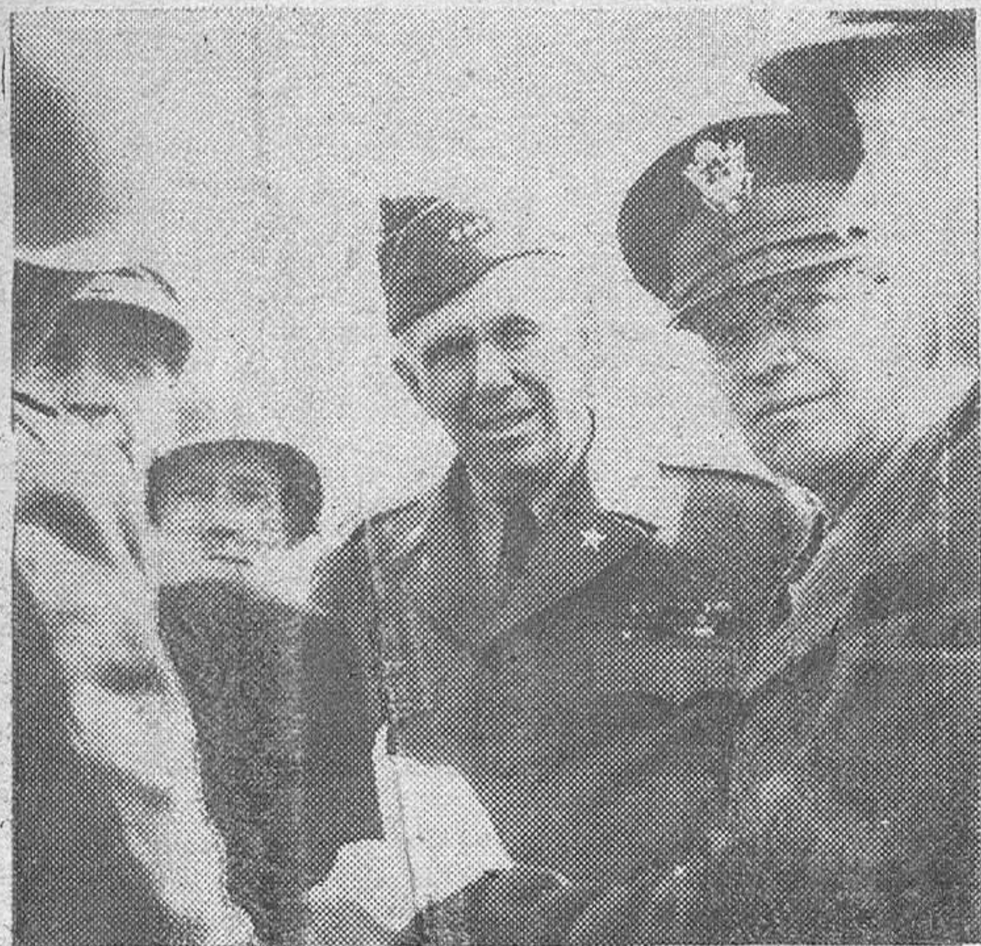
El almirante King y los generales Eisenhower y Marshall, visitan una de las posiciones avanzadas en el frente de Holanda

La guarnición alemana resiste encarnizadamente