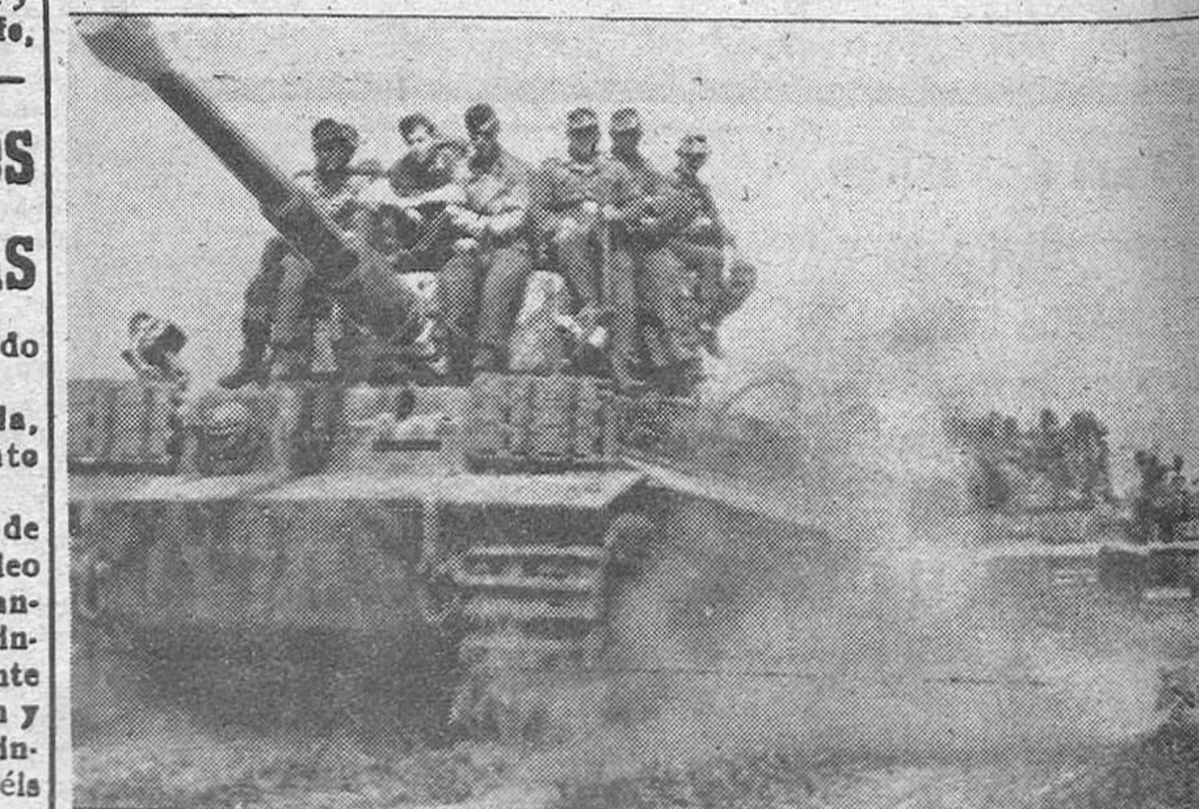
Infantería alemana avanzando hacia las líneas rusas transportada en tanques «Tigris»