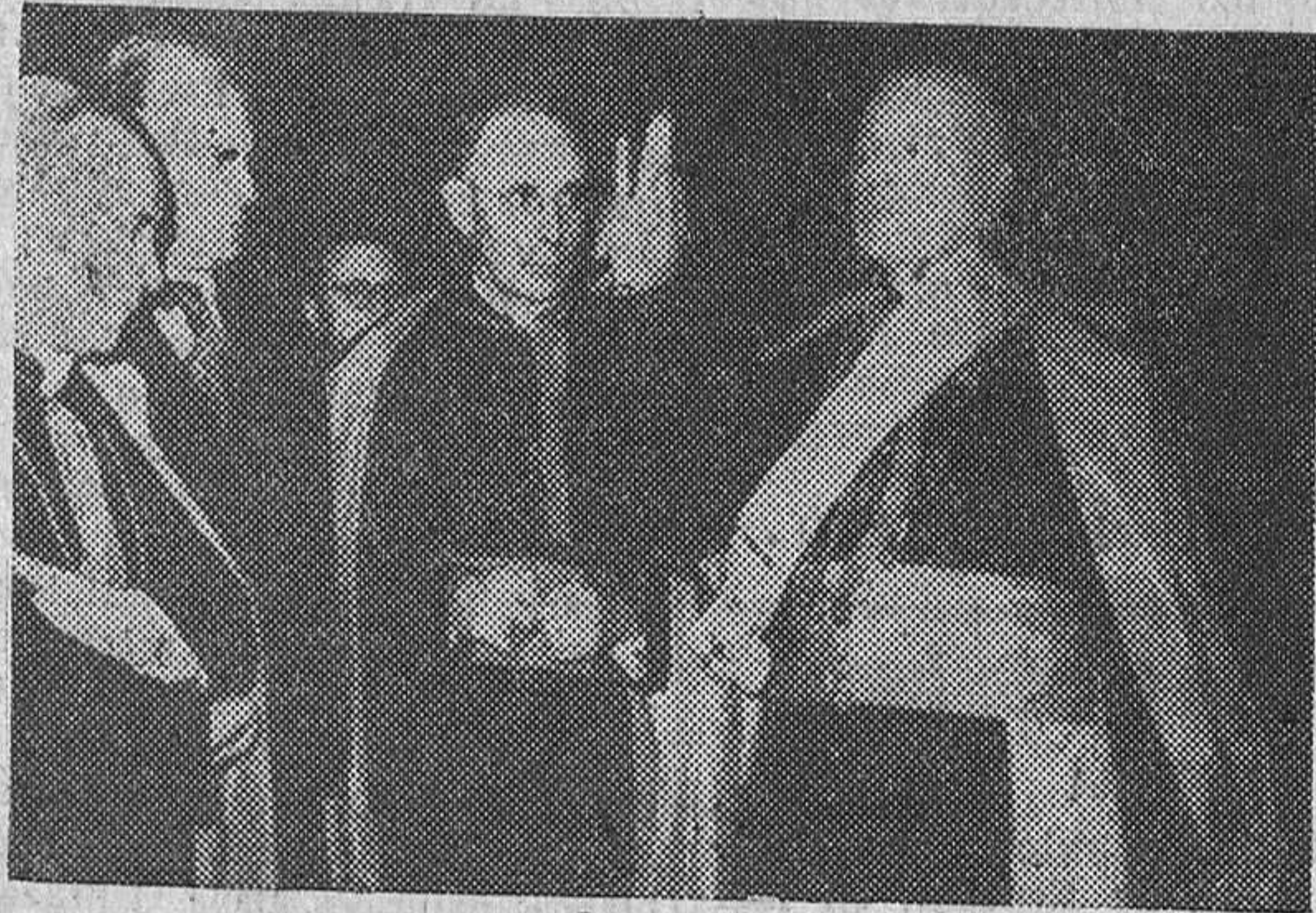
Su Eminencia el Cardenal Tedeschini, que inauguró ayer, como Legado de Su Santidad, el XXXV Congreso Internacional de Barcelona.

DAKAR, 27.—Dos de los dieciocho tripulantes y pasajeros del avión de la B.O.A.C. que se estrelló ayer en el Sahara, al sur de Port-Etienne, resultaron ligeramente heridos. Los demás se encuentran ilesos, según informan los equipos de salvamento.—Efe.