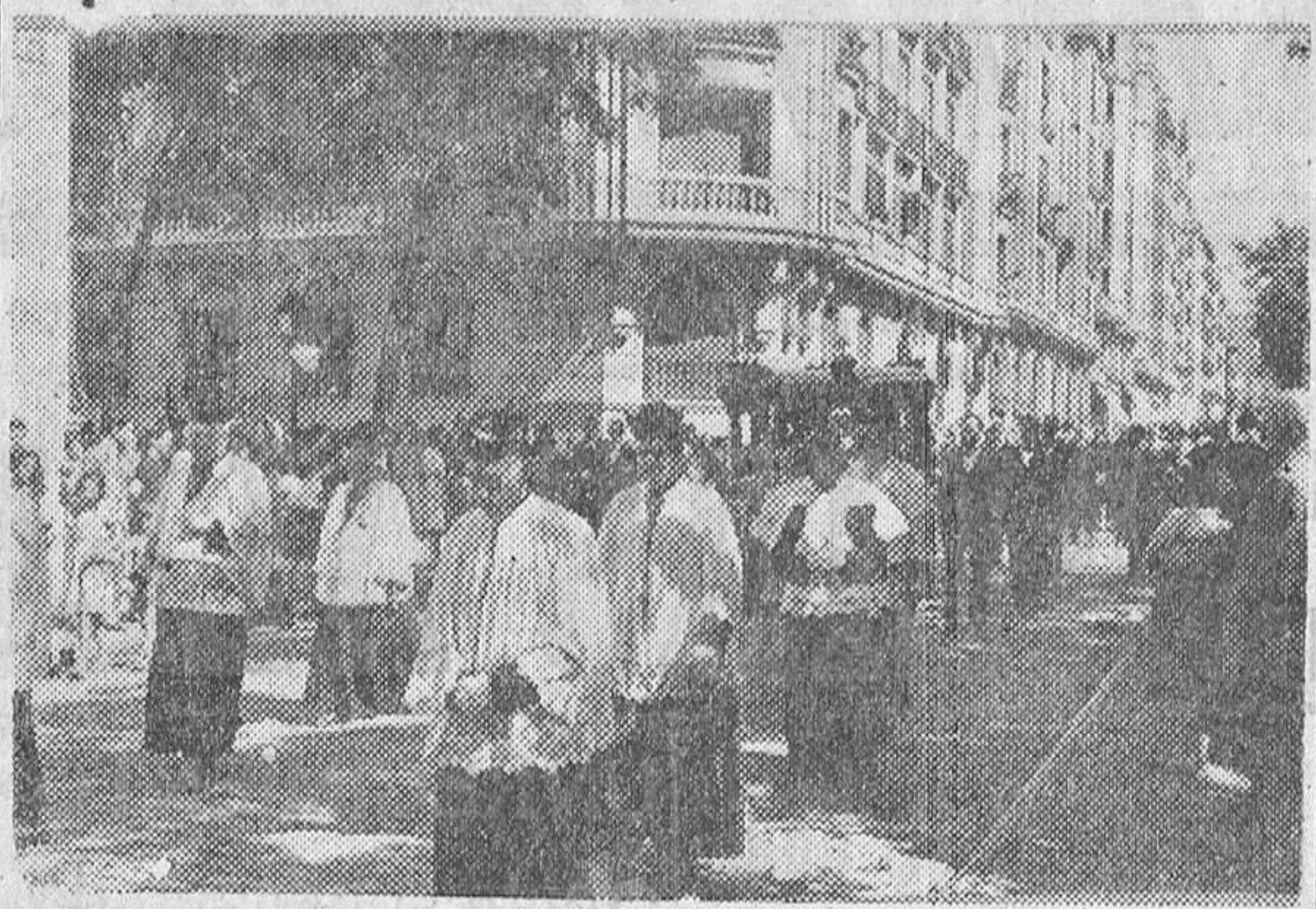
La carroza fúnebre con los restos del señor Alvarez Quintero desfila por la calle de Velásquez ante un inmenso gentío que se agolpa en el trayecto para testimoniar su afesto al comediógrafo muerto.