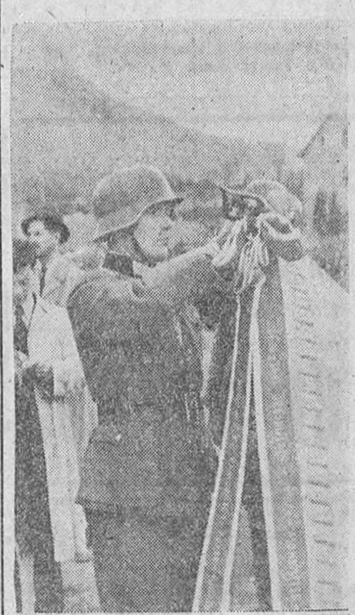
Un regimiento croata que se distinguió recientemente en varias ocasiones victoriosas le han sido concedidas por el Poglavnic varias cintas adicionales para su bandera