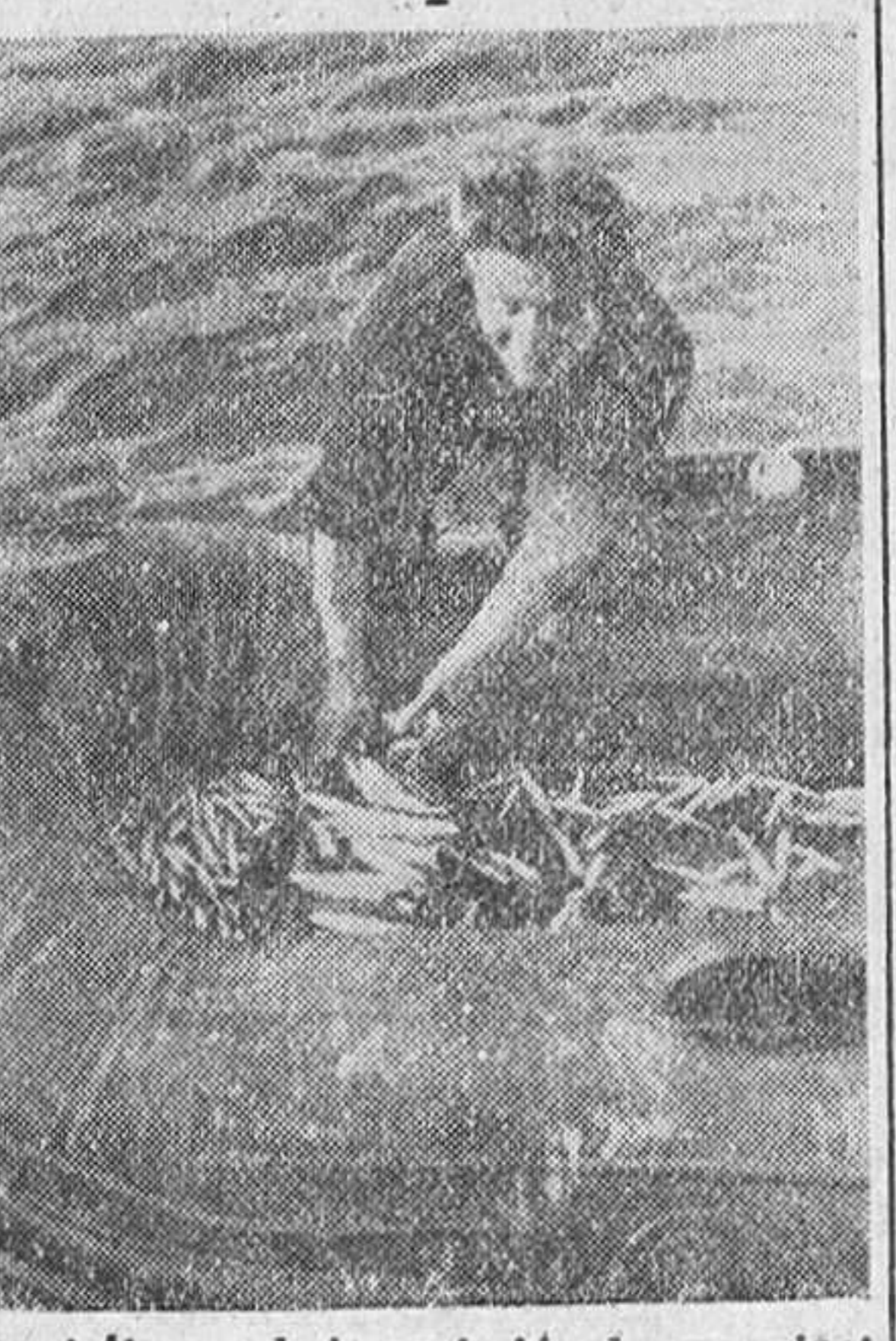
Por la fuerza de la explosión de una mina numerosos peces muertos son ahora recogidos por este marino alemán para mejorar el rancho.