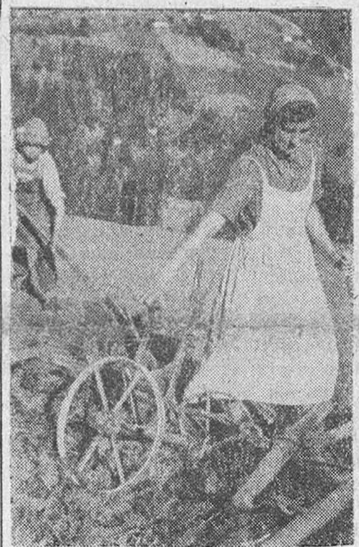
Mujeres alemanas movilizadas ayudan a los campesinos a recoger sus cosechas