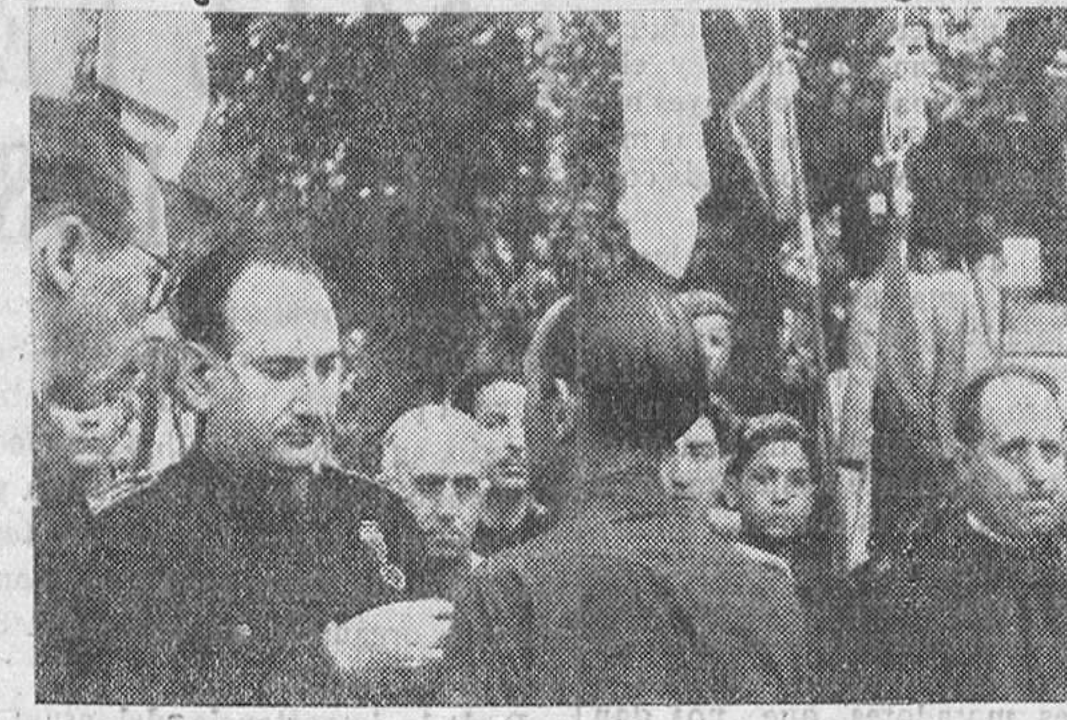
El Ministro Secretario General del Movimiento, camarada José Luis Arrese impone la medalla de la Vieja Guardia a un escuadrista de Jaén durante su última visita a la ciudad.