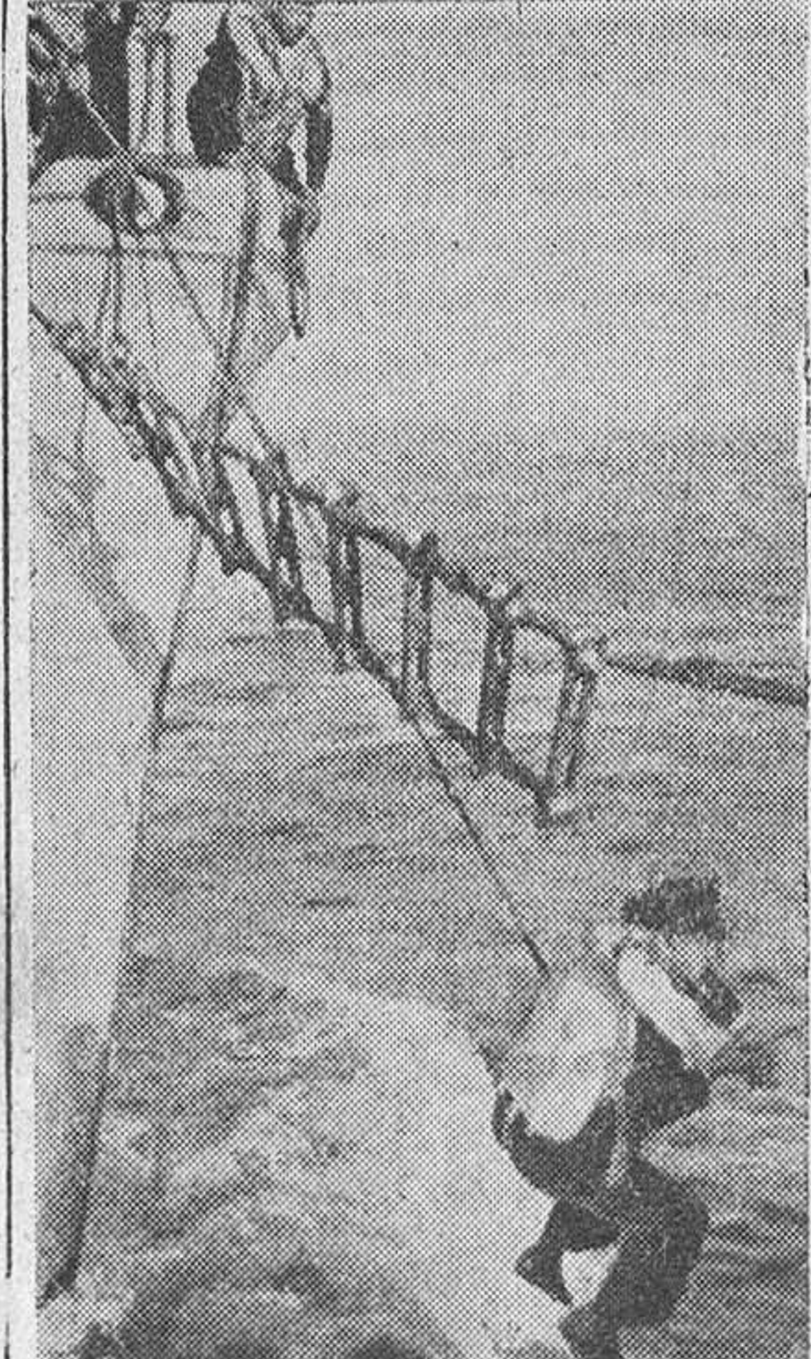
Para comunicar una orden dada por el jefe de una flotilla de buseaminas, el enlace pasa de un barco a otro