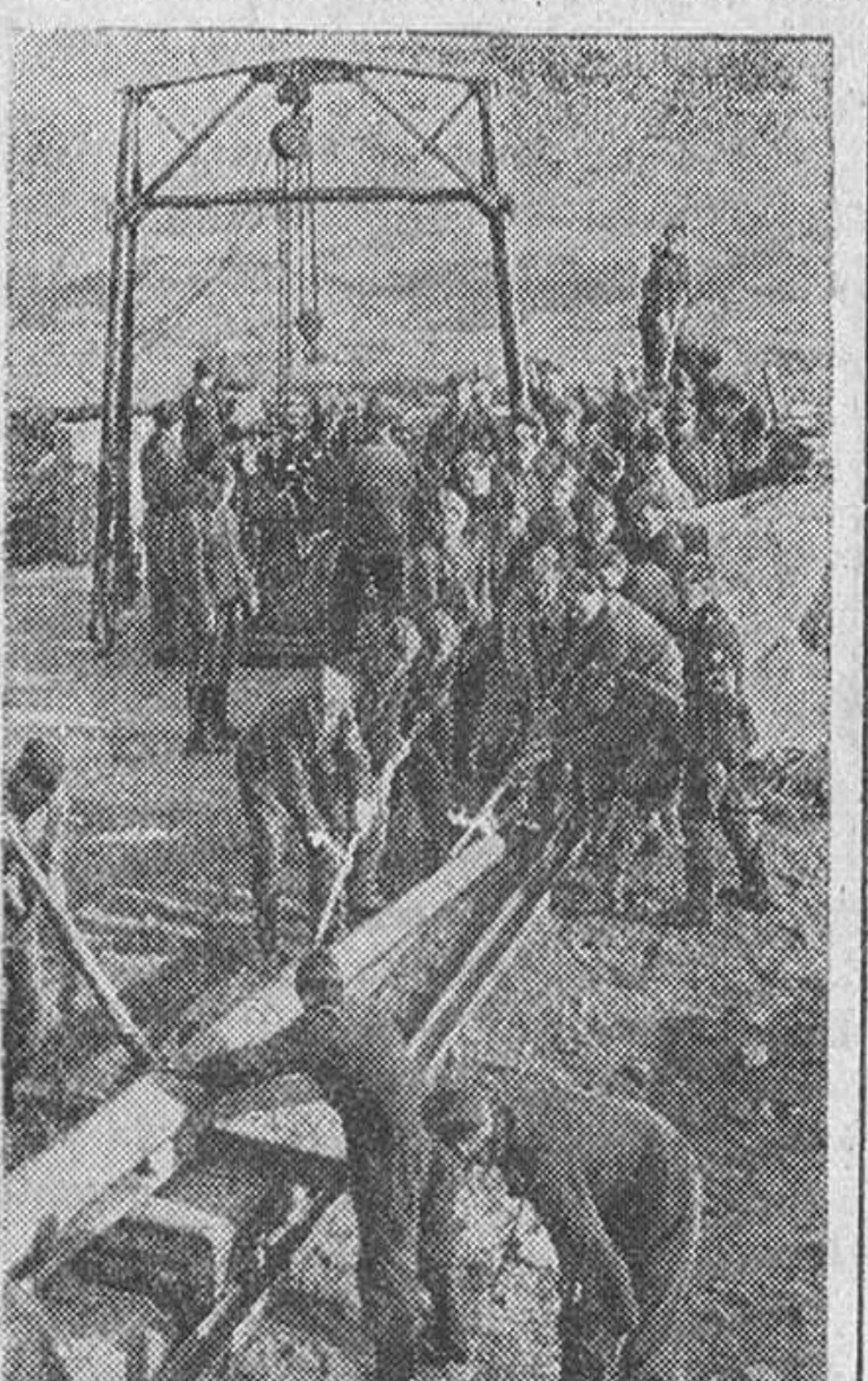
Muchachos del Servicio de Trabajo alemán cambiando de posición una pieza anti-aérea pesada