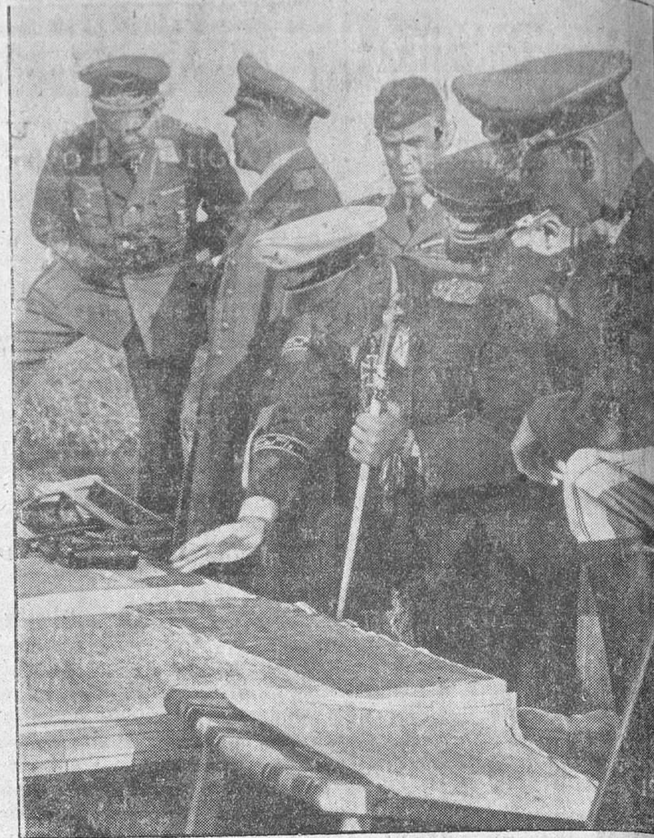
El mariscal del Reich Hermann Goering dirige personalmente la gran batalla aérea contra Inglaterra. La foto muestra al mariscal en su puesto de mando rodeado de su Estado Mayor.

Terminada la guerra del 14, se inscribe como simple militante en las filas del fascismo y desde entonces se convierte en eficaz colaborador de Mussolini, que le nombra cuadriviro de la Revolución, primer comandante general de la Milicia voluntaria y gobernador de Tripolitania, en cuyo puesto madura la idea de la reivindicación de Adua y la creación del Imperio. En el cargo de alto comisario de las colonias del Africa oriental y coman-