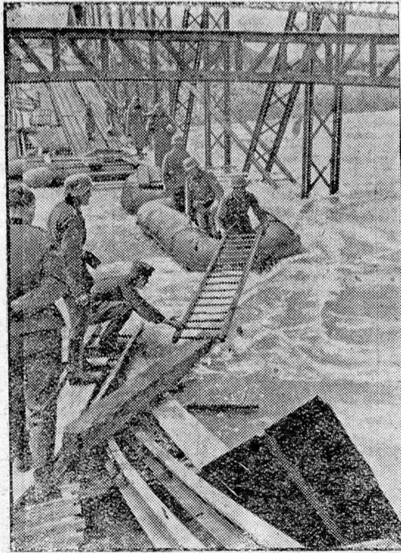
Puente sobre el río Drau, destruido por los servios para impedir el avance alemán, que rápidamente es reconstruido por los pontoneros alemanes

En el premio de la montaña, Berrendero figura clasificado en primer lugar, seguido inmediatamente de Trueba y Esquerria.—Cifra.