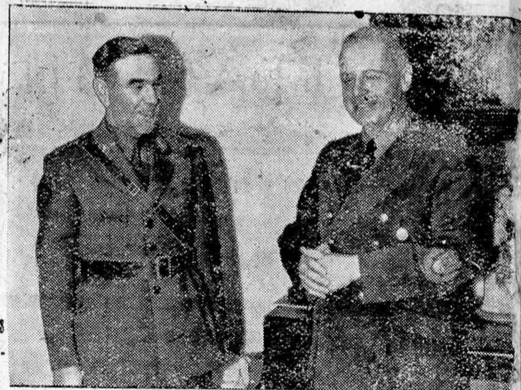
El jefe de los croatas, Ante Pavelic, con el ministro de Negocios Extranjeros del Reich, von Ribbentrop, en una de sus recientes entrevistas.