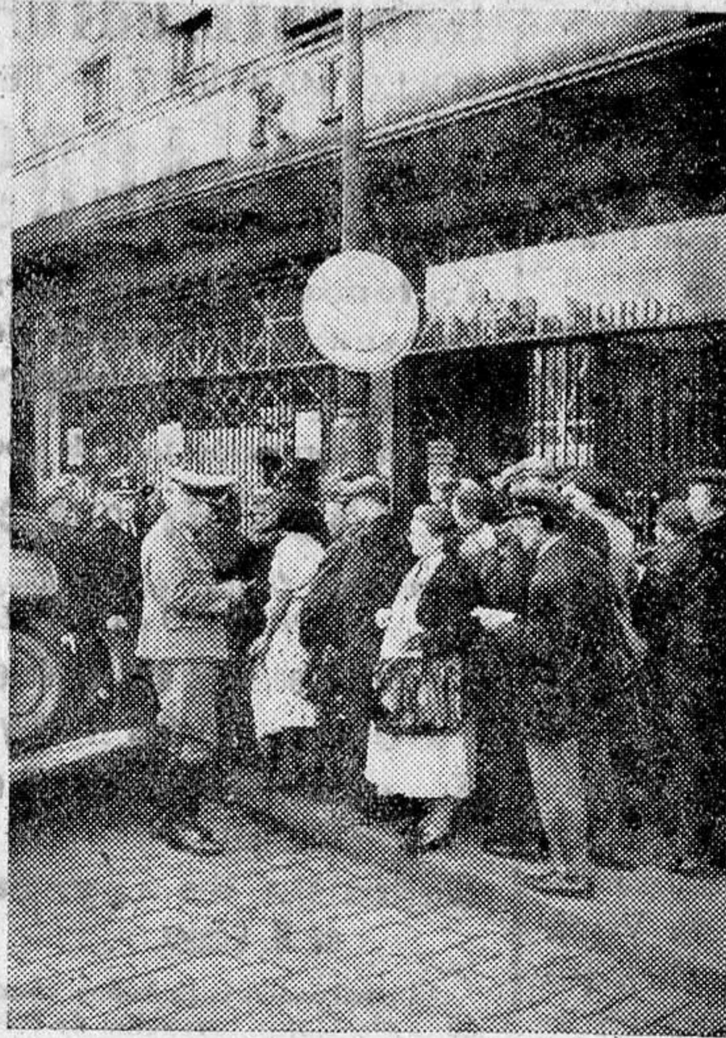
El Auxilio Social alemán actúa en toda la Francia ocupada. He aquí su delegación en Lille

de reciente construcción, céntrica, con grandes paneras, propia para negocios. Informes en esta Administración. (346)