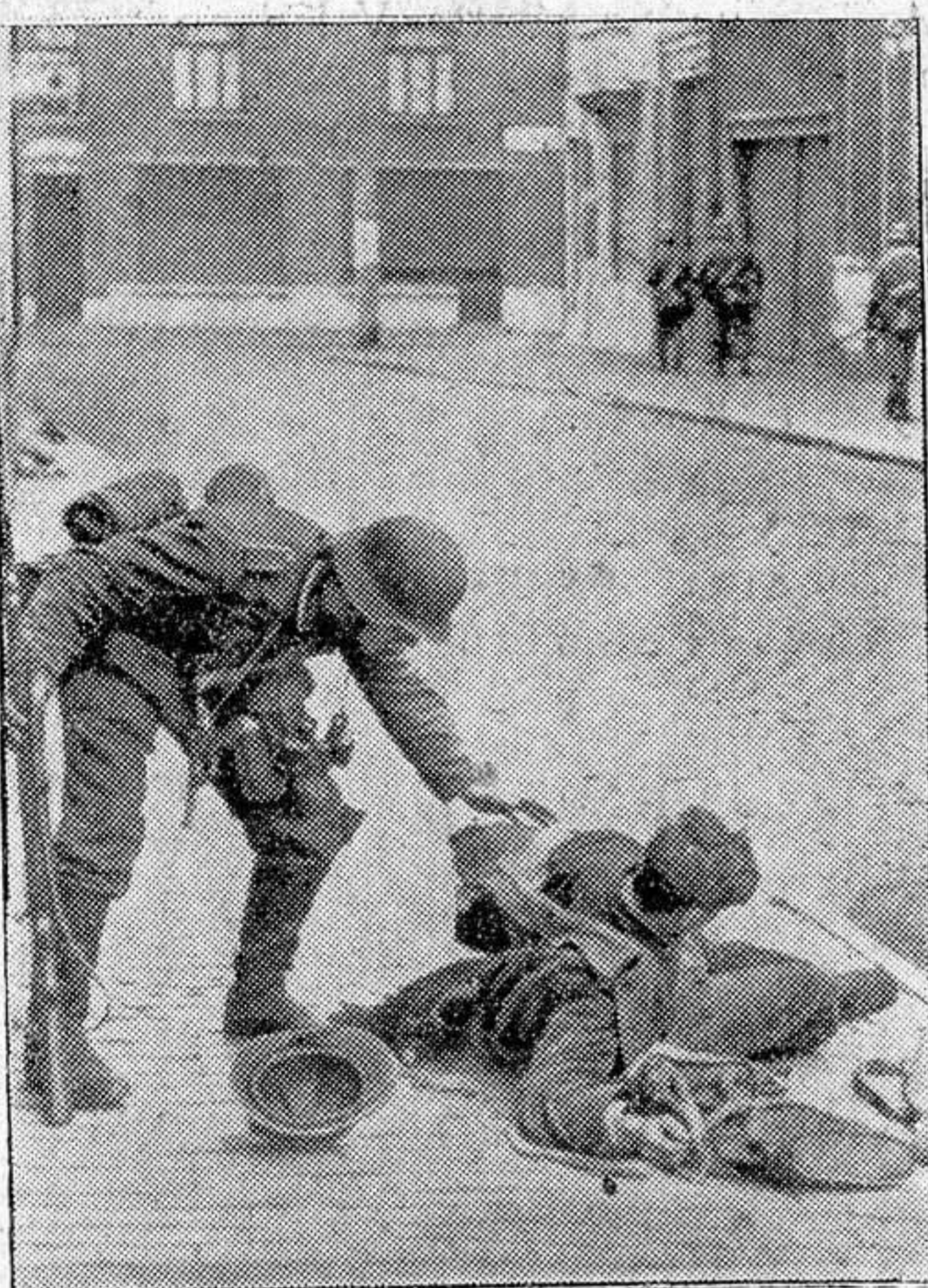
Código de Caballeros.—En plena lucha callejera, este soldado alemán se ocupó solicitamente de un francés herido retirándole del alcance de las balas

Berlín, 31.—El Cuartel general del Führer comunica: «El mal tiempo ha limitado forzosamente la acción de los aviones alemanes. A pesar de ello, se han realizado vuelos de reconocimiento por la costa oriental y meridional de Inglaterra, así como contra las fábricas de aviones de Filton. También han sido bombardeadas las instalaciones de los puertos de Swansea y Plymouth. En la noche pasada los aviones ingleses volaron sobre la parte septentrional de Alemania. Han causado pocos daños materiales y no ha habido víctimas. Dos aviones que volaban sobre Alemania, han sido derribados por nuestros cazas. Se ha sabido que el día 29 de julio fueron derribados en total 21 aviones ingleses».—Efe.