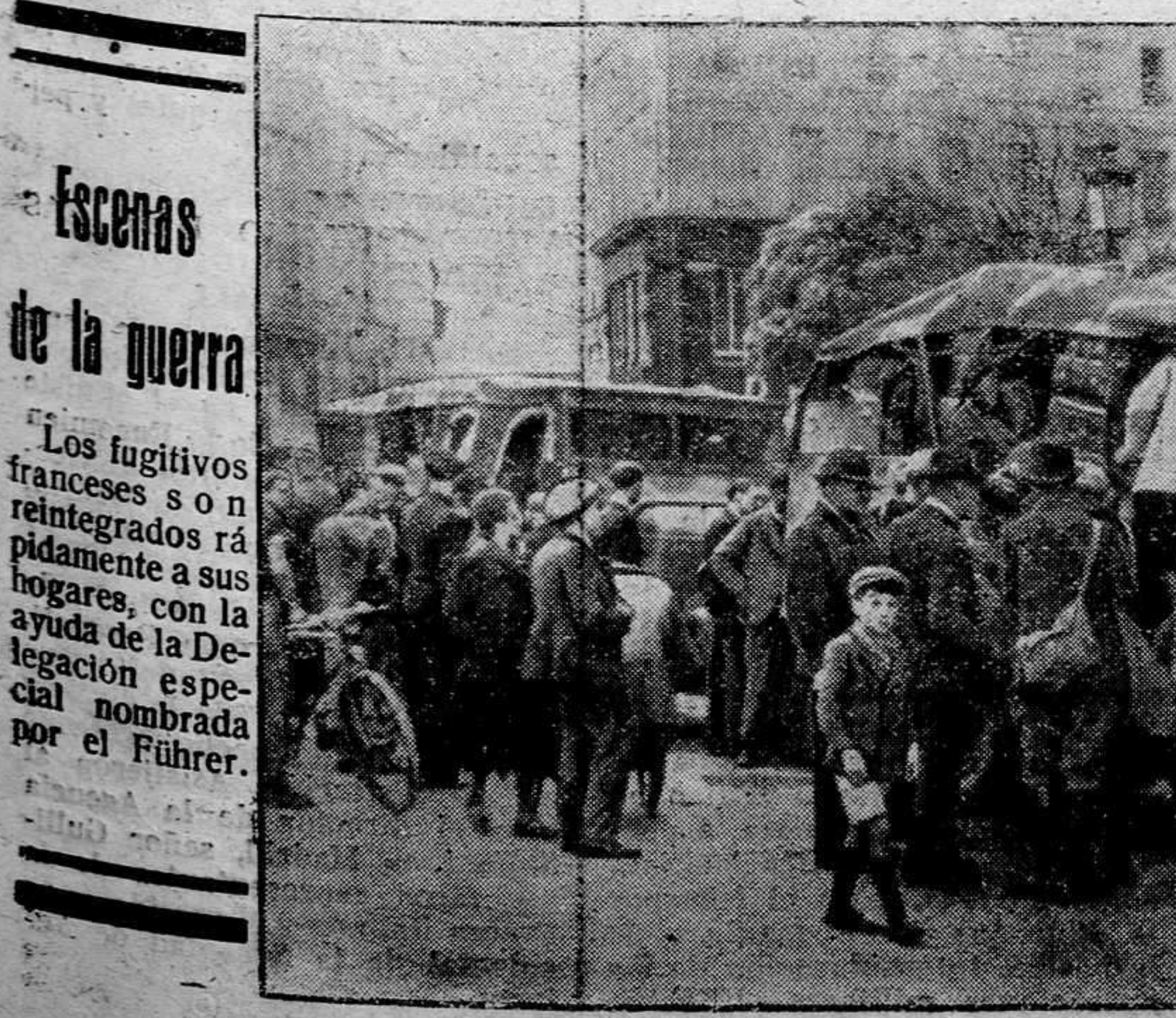
Escenas de la guerra

NAIROBI.—Comunicado británico: "Nuestra guarnición de Moyale, que había estado cercada durante estos últimos cinco días, se ha repliegado en el noche última, sin incidentes, de acuerdo con los planes del mando".—EFE. UN ARTICULO DE MANUEL AZNAR REPRODUCIDO EN ALEMANIA BERLIN.—Los artículos que acaba de publicar Manuel Aznar dedicados al interesante tema de la nueva España ante la nueva Europa, ha encontrado una enorme acogida en la Prensa alemana, que reproduce las principales afirmaciones del ilustre periodista español.—EFE. EL PRESIDENTE QUEZEN MANILA.—El presidente Quezen ha pedido a la Asamblea Nacional filipina, poderes extraordinarios para combatir la situación económica agravada por la guerra europea.—EFE. SIGUEN LOS DESORDENES EN GIBRALTAR ROMA.—Los diarios italianos anuncian que otros dos barcos con fugitivos de Gibraltar que han intentado que salir de nuevo del Marruecos francés han llegado a su punto de partida. Las autoridades de Gibraltar les han prohibido desembarcar y ha habido con este motivo fuertes reyertas. Agregan que las autoridades han ordenado el cierre de todos los almacenes y casas de comercio. Se cree que esta medida ha sido tomada pa-