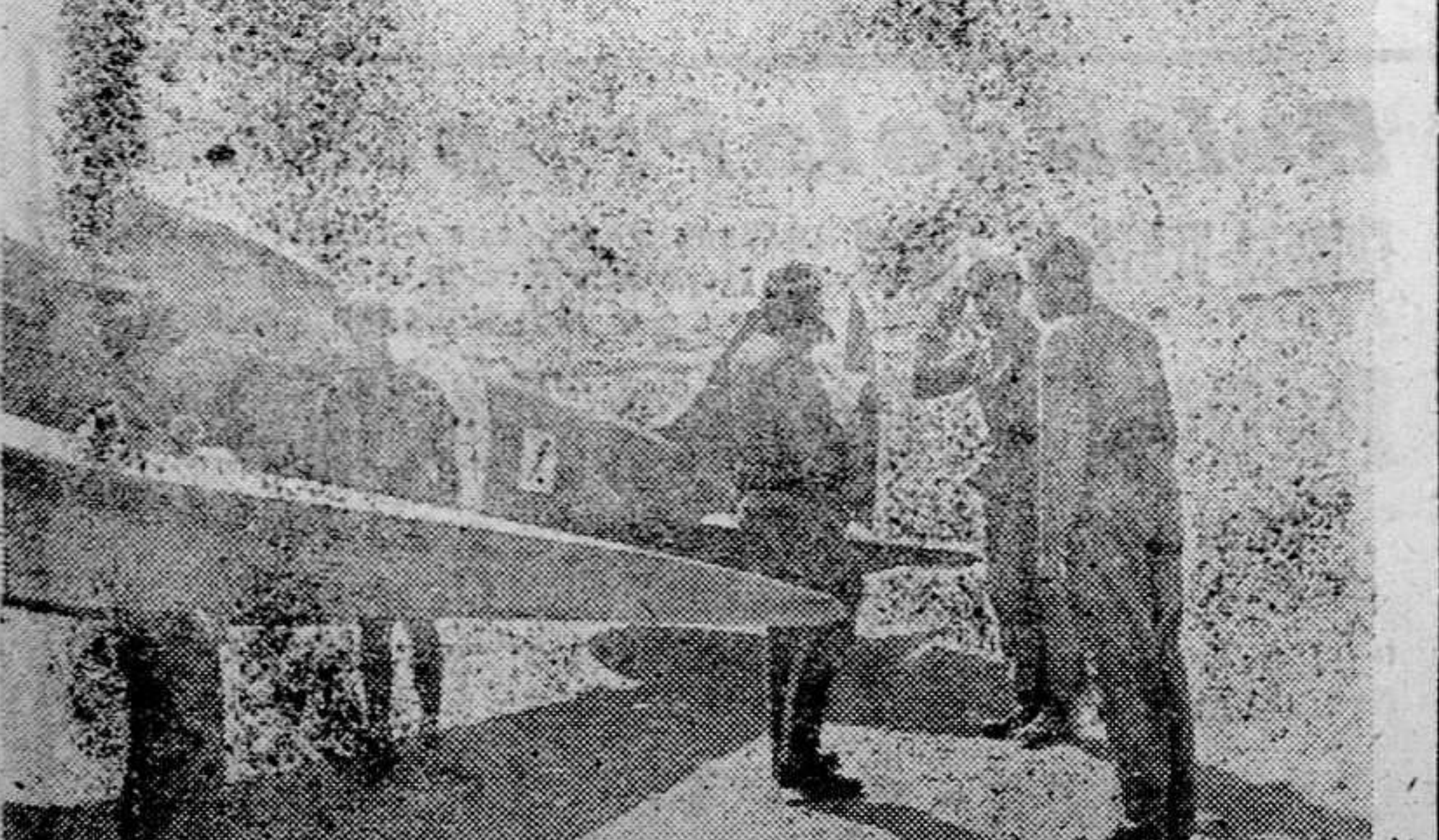
Confraternidad de armas del Africa del Norte. Un general italiano que visitó una base aérea de pilotos de caza alemanes, es recibido por el comandante en jefe a su llegada.