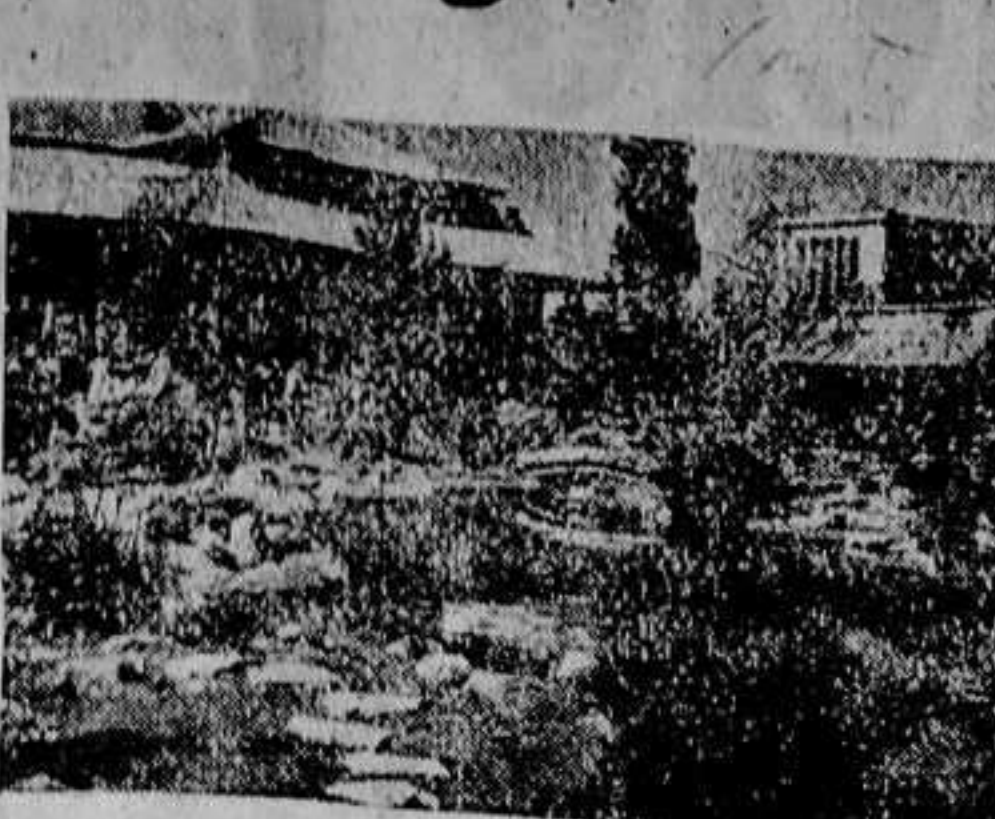
El bellissimo jardín japonés de la exposición

Y se engrandecen mucho más en estos momentos, la ciudad que sosteniendo la guerra más gigantesca que se ha conocido, no olvida esta manifestación tan suya, tan íntima y la dedica su máxima reverencia. Nos referimos a Berlín, la gran capital alemana—tan devota de la flor, en sus bellos jardines, en sus magníficos paseos y admirables alrededores—, que aún viviendo en plena lucha, ha celebrado como todos los años, su gran Exposición llamada de “Flores estivales alrededor de la torre