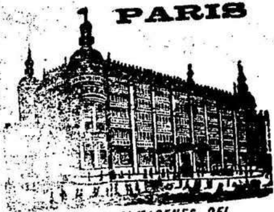
GRANDES ALMACENES DEL