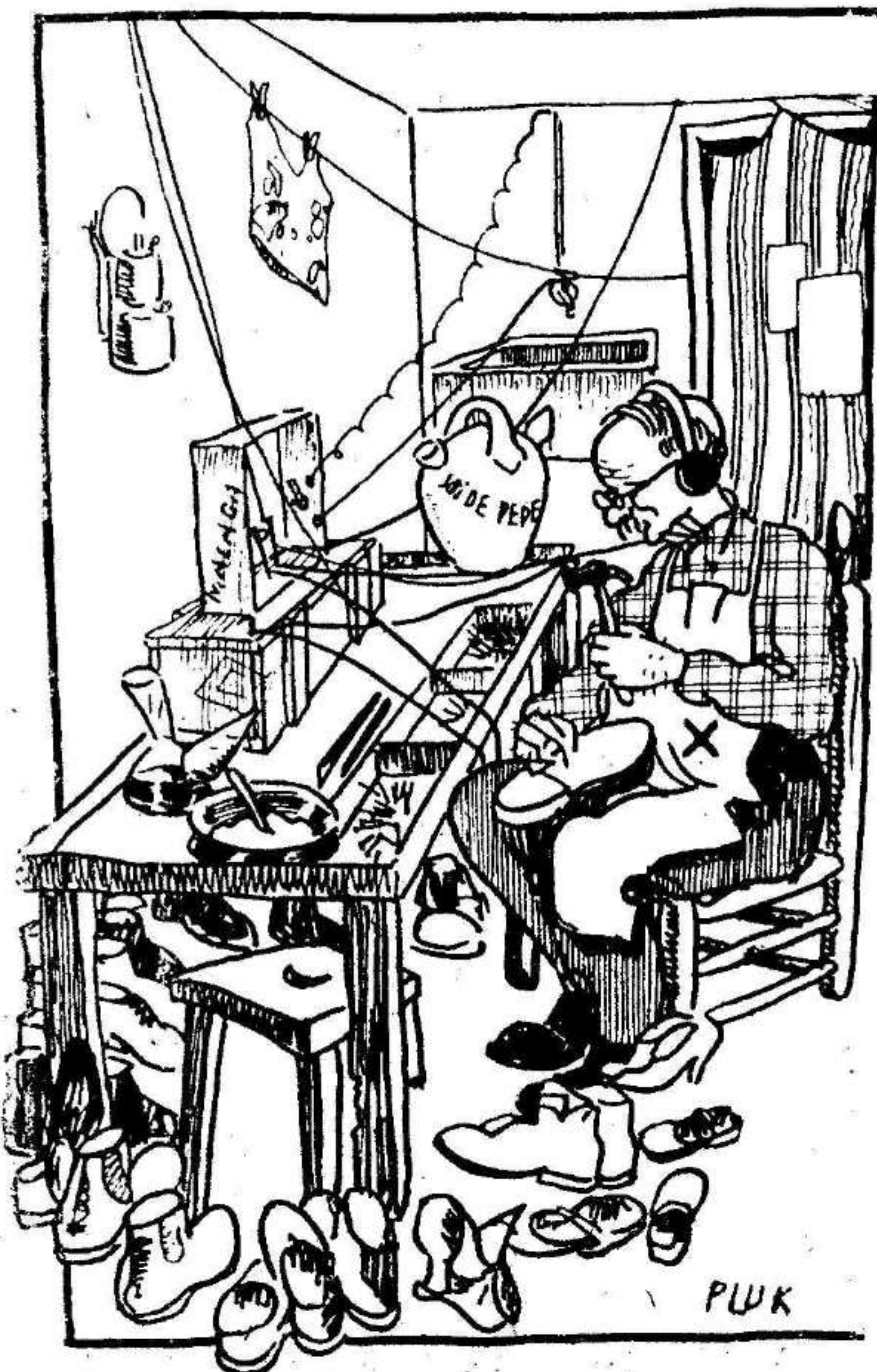
La receptora E. A. Z. R. (Tabernillas, 23), en plena actividad.

—¿Tú...! ¡Tú...! ¡¡Tú...!! (despertando de una patada al Sebastián). ¡Que ya han empezao con las juanolas!