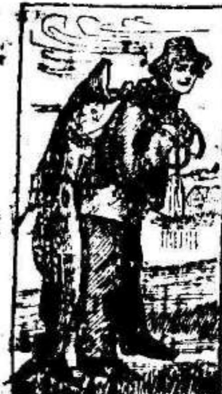
Marca de fábrica.

No es un remedio nuevo que está aún por probarse. Lo conocen favorablemente y lo recetan los principales médicos en casi todos los países del mundo desde hace más de veinte años. Esto se debe á que la Emulsión de Scott es valiosísima en todos los casos de extenuación ó pérdida de carnes. La Tisis, que se consideraba incurable antes de conocerse la Emulsión de Scott, cede ahora rápidamente en sus primeros grados á la potente influencia de este medicamento. Es un maravilloso nutritivo. Con su uso los niños se desarrollan y engruesan cuando la alimentación ordinaria no les nutre en absoluto.