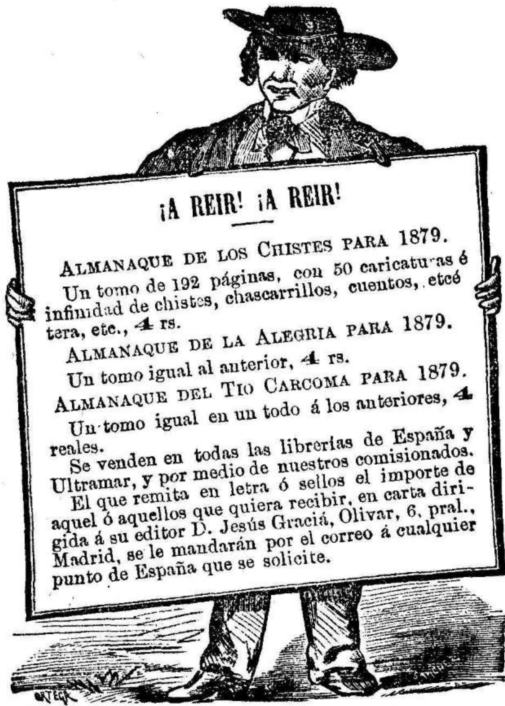
En Murcia en la imprenta de LA PAZ, Zoco, 5.