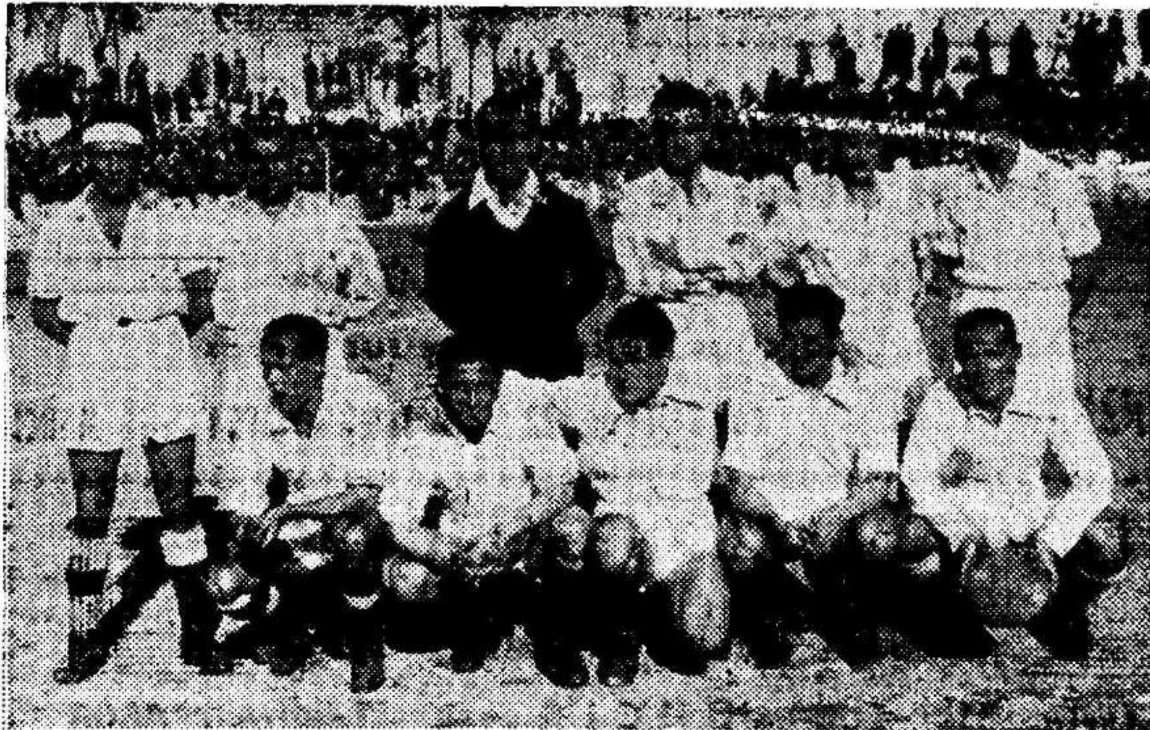
Equipo del Ceuta vencido ayer en la Condomina por 2 a 0