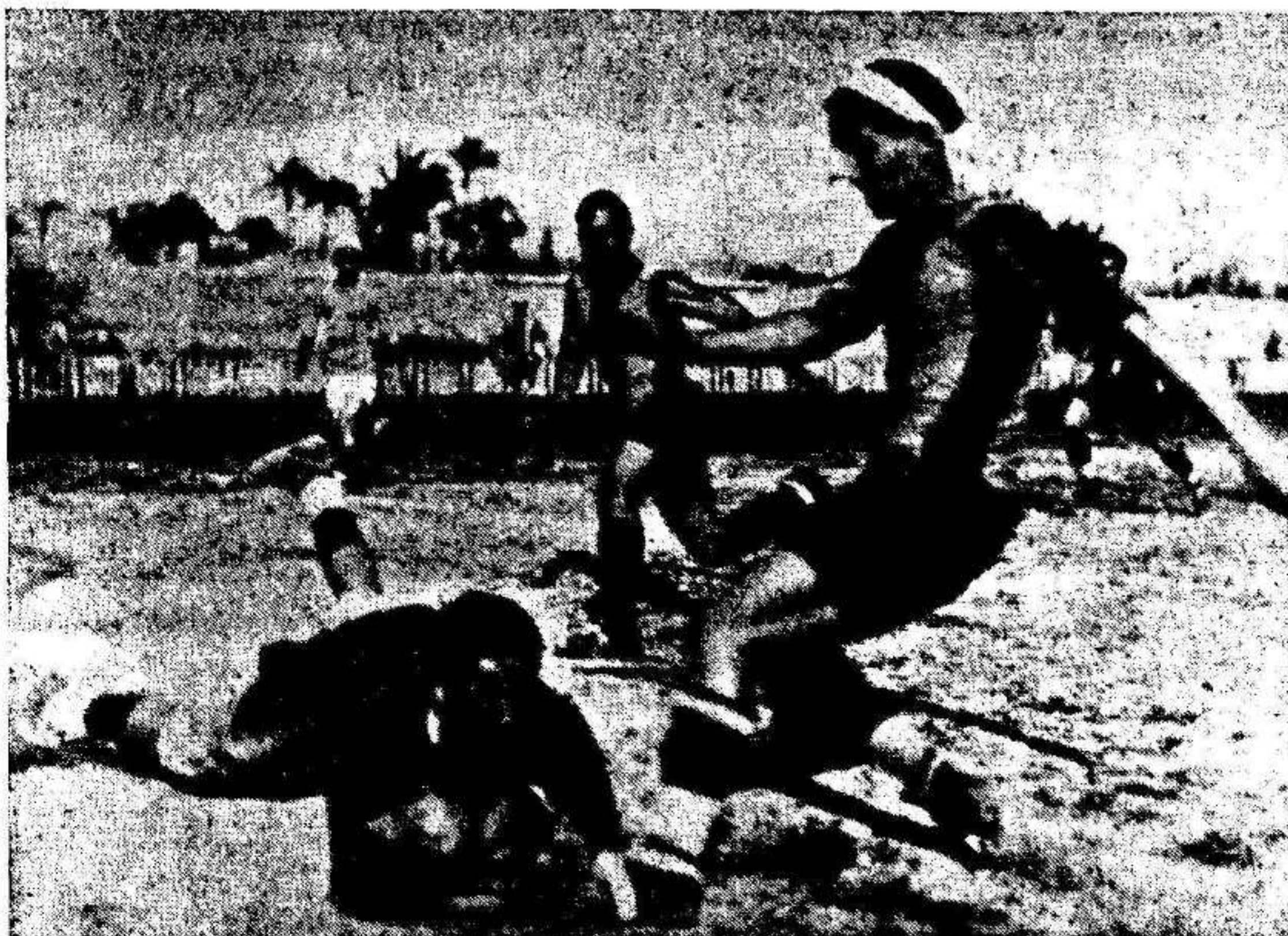
El guardameta del Crevillente se lanza a los pies de Cano y evita un goal que parecia seguro.