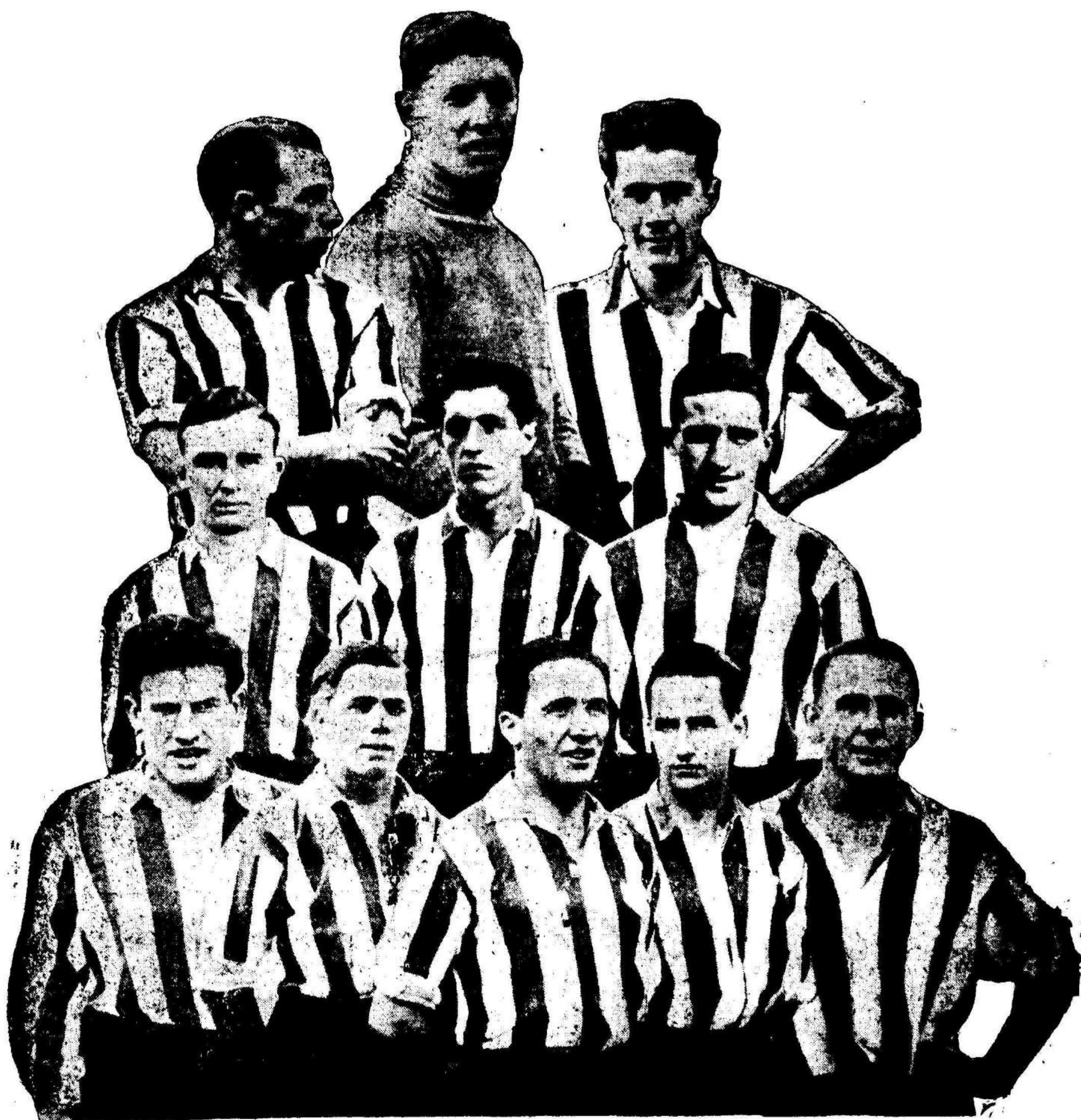
El Atlétic Club de Bilbao

El notable equipo vizcaíno, que en un match disputadísimo venció al F. C. Barcelona, por un goal a cero, adjudicándose nuevamente el título de Campeón de España