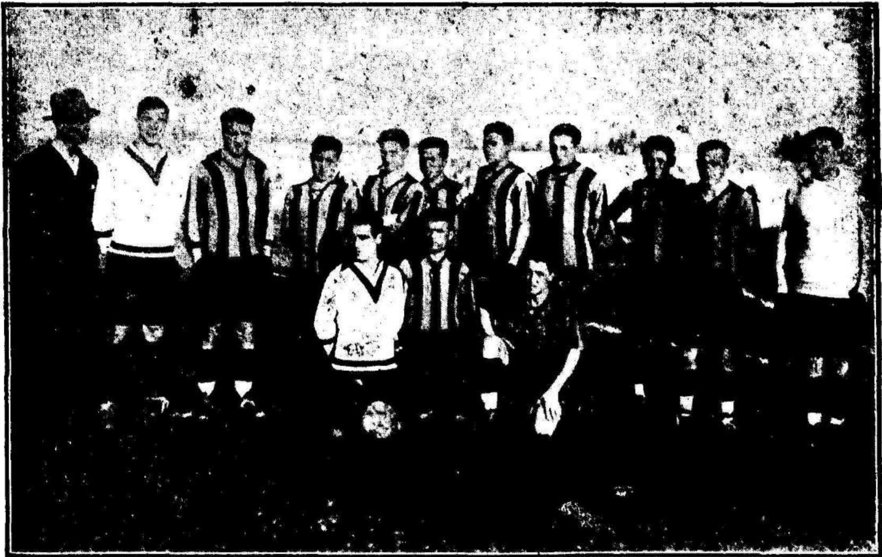
El equipo del Iberia de Zaragoza, Campeón de Aragón, que empató ayer con el Real Murcia en la Condomina.