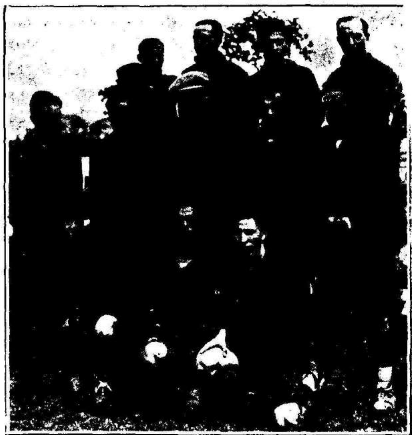
El Malagueño F. C.