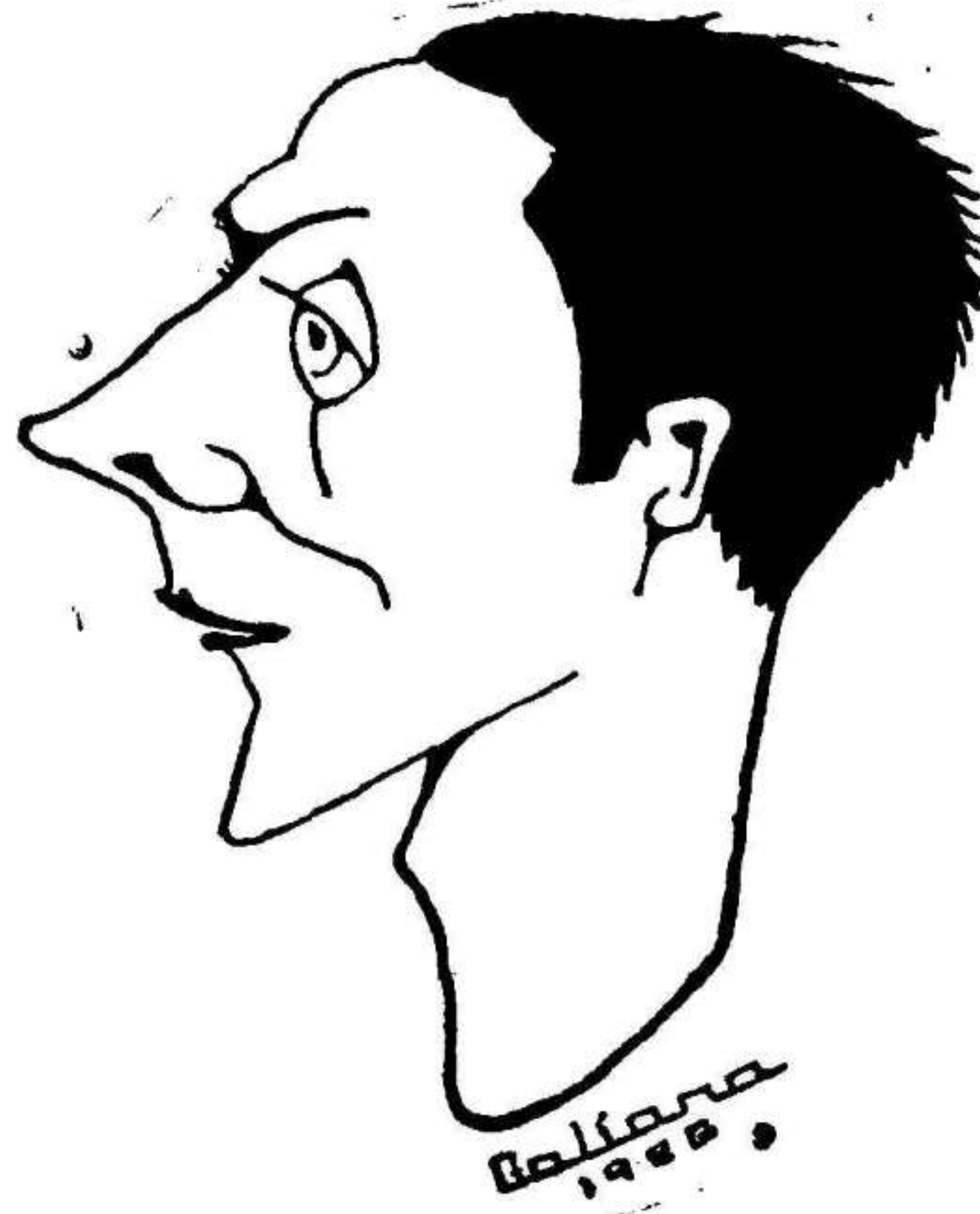
PAZ, el mejor jugador del Cartagena en el partido de ayer.

En una sola se lanza un formidable chut que Yusep en fantástica estirada desvió a corner, que tirado no ofrece peligro para el Murcia.