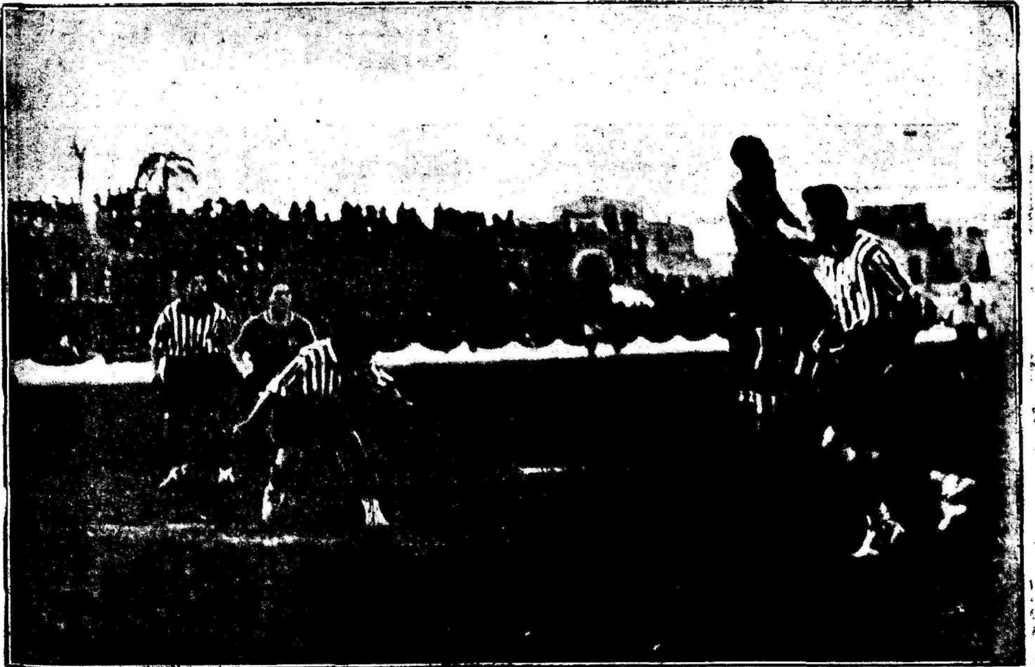
Un bonito remate de cabeza de Zemorite, estrechamente marcado por la defensa blanquinegra