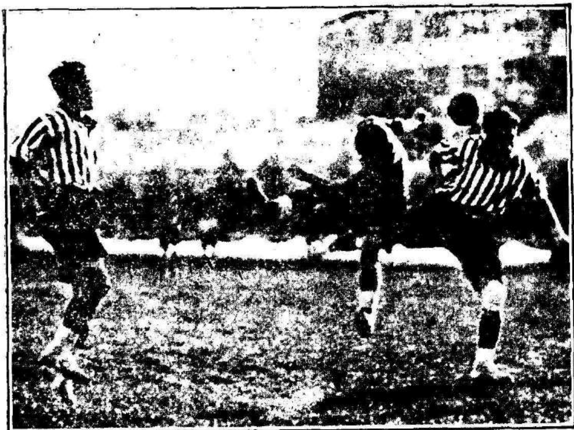
1. Un enérgico remate de Zamora