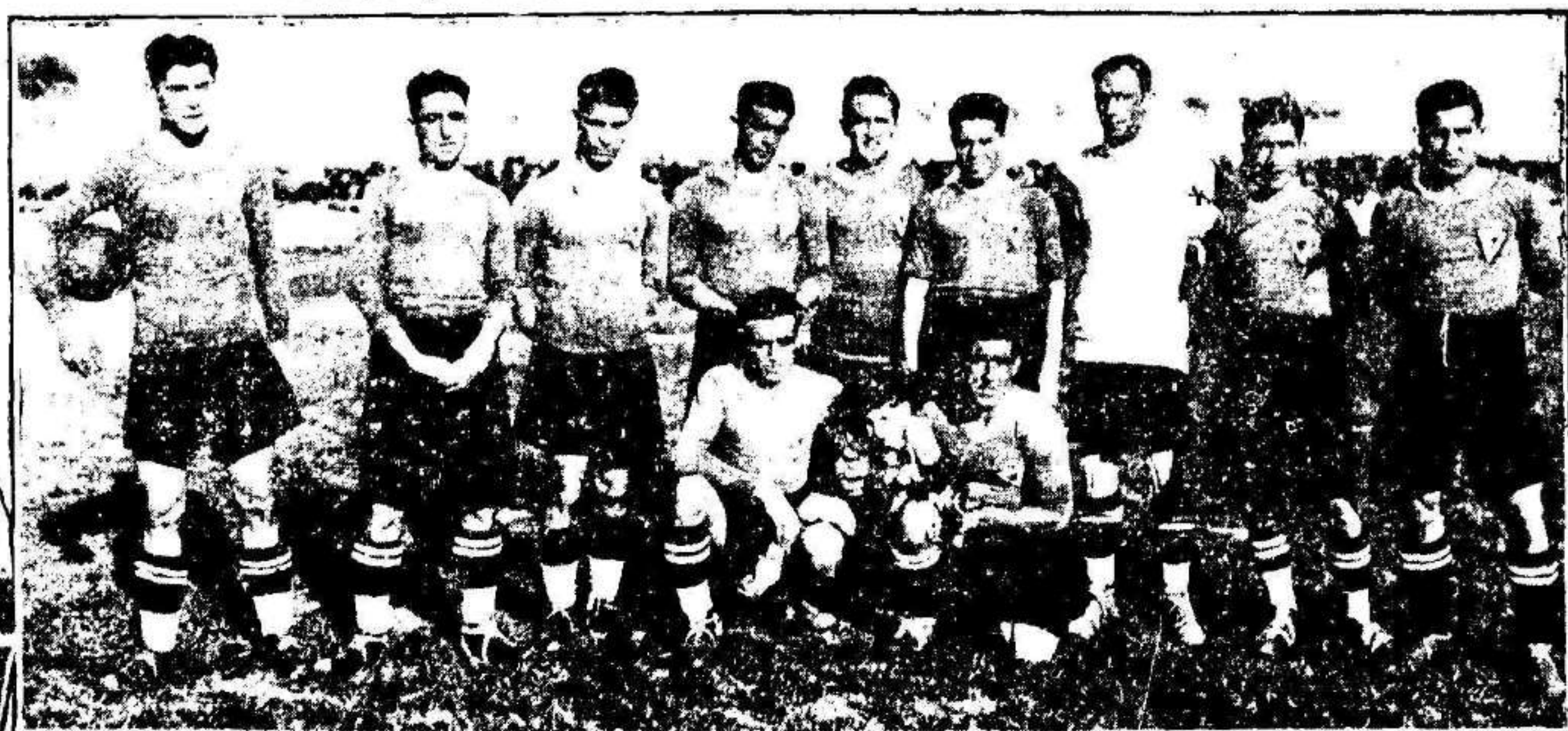
4. Equipo del Real Murcia que venció al Cartagena en la Condomina 5. Una situación peligrosa para el marco cartagenero