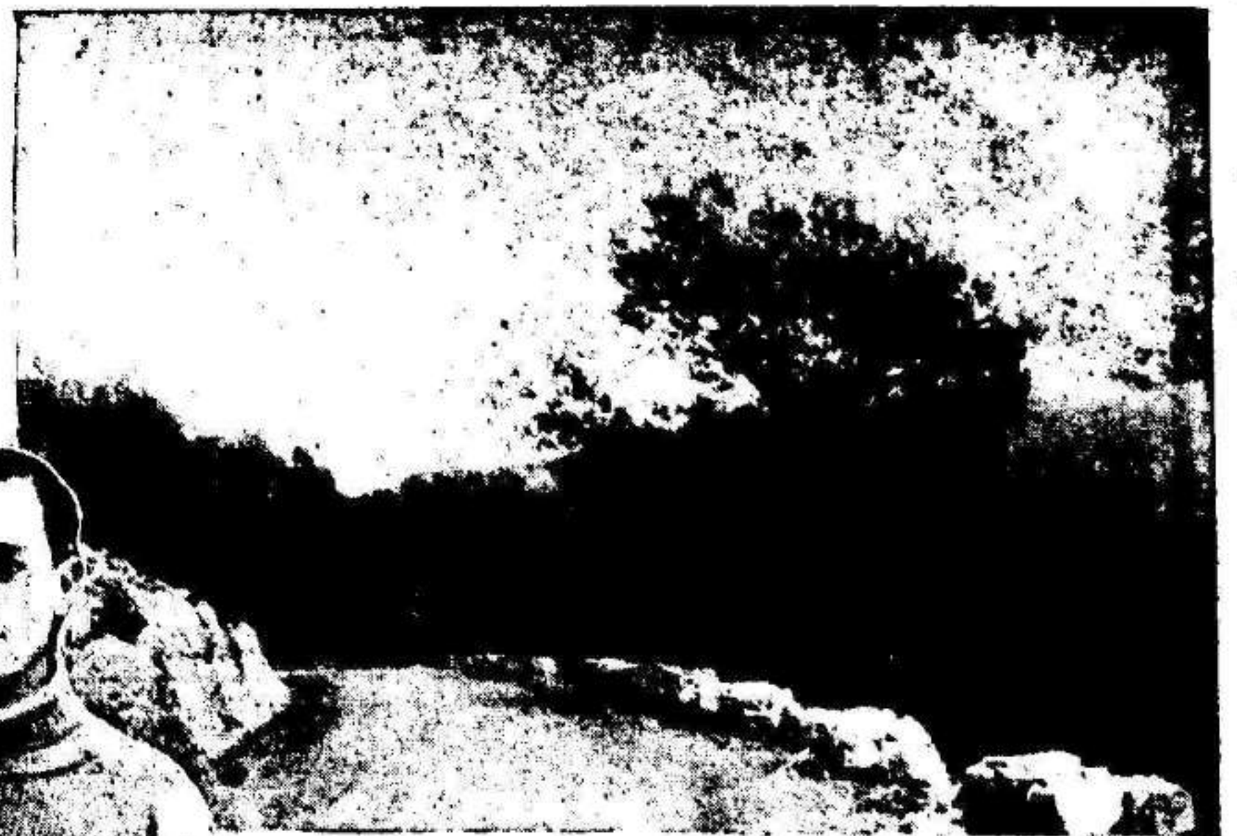
Pintoresca curva de la subida a España