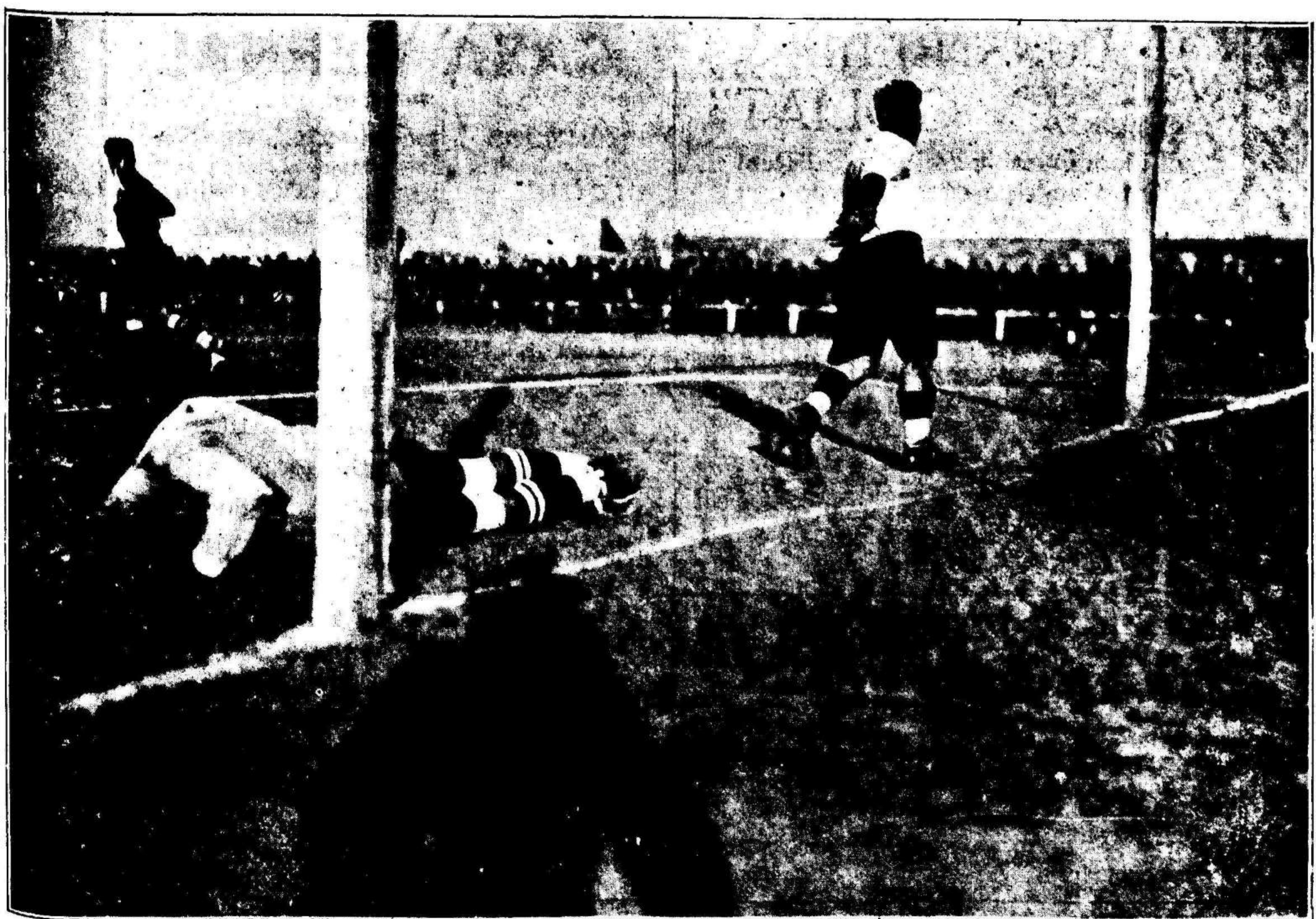
El primer goal del Real Murcia, conseguido por Albaladejo, impecablemente, haciendo inútil el "plongeon" de Amadeo