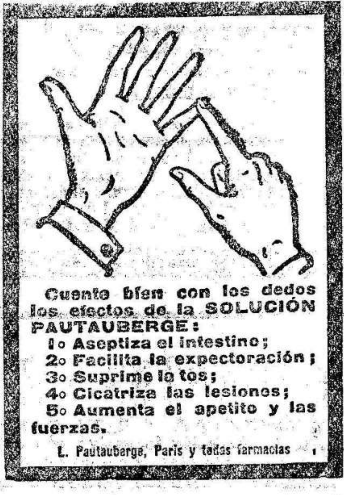
Cuanto bien con las manos los efectos de la SOLUCIÓN PAVTAUBERGE: