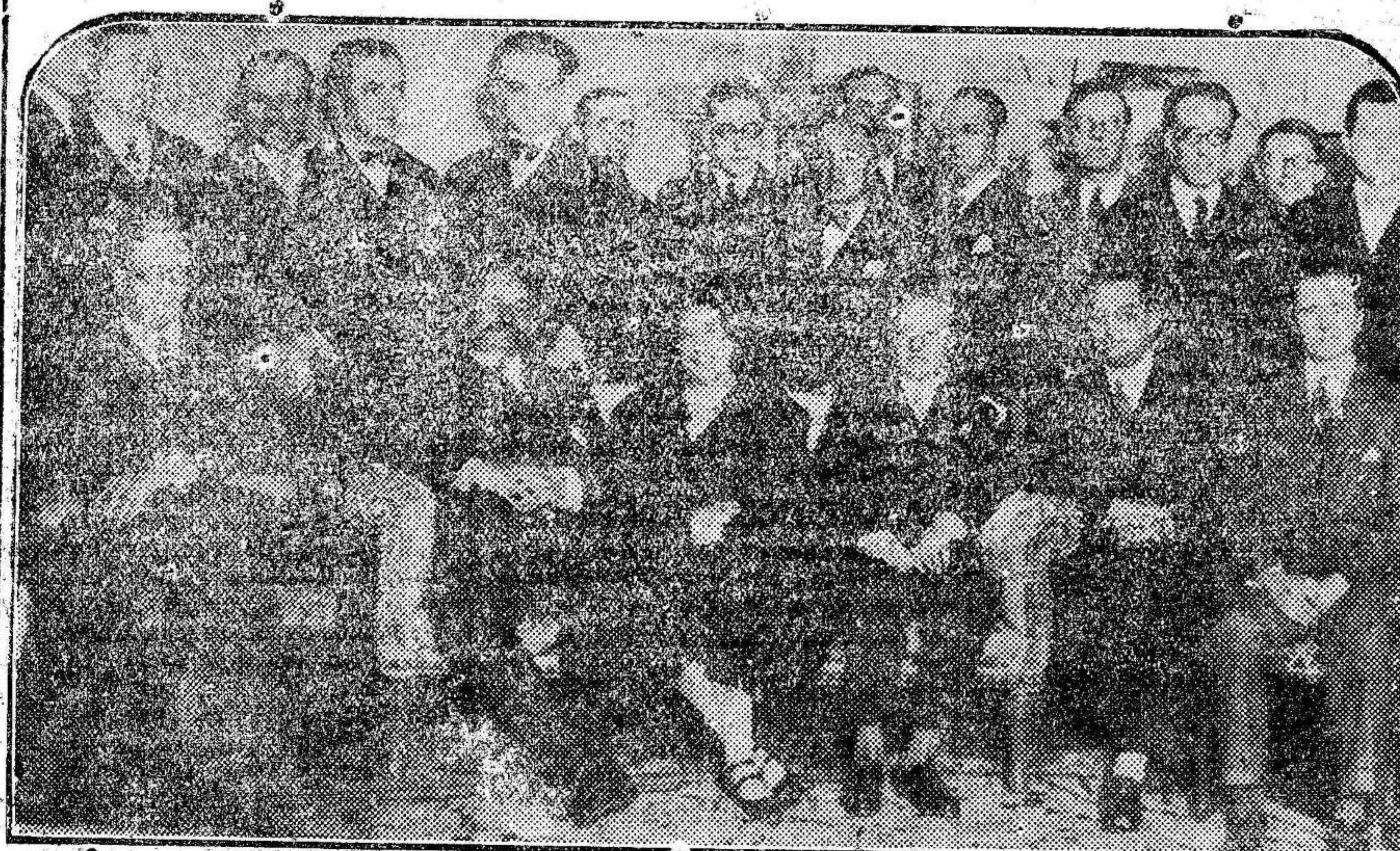
MADRID.—El conde de Romanones, rodeado por los corresponsales de los periódicos extranjeros en Madrid, a los que obsequió con un banquete.

Que todo el que pueda se dirija al Gobierno, pidiendo que no se cumpla la trágica y terrible sentencia.