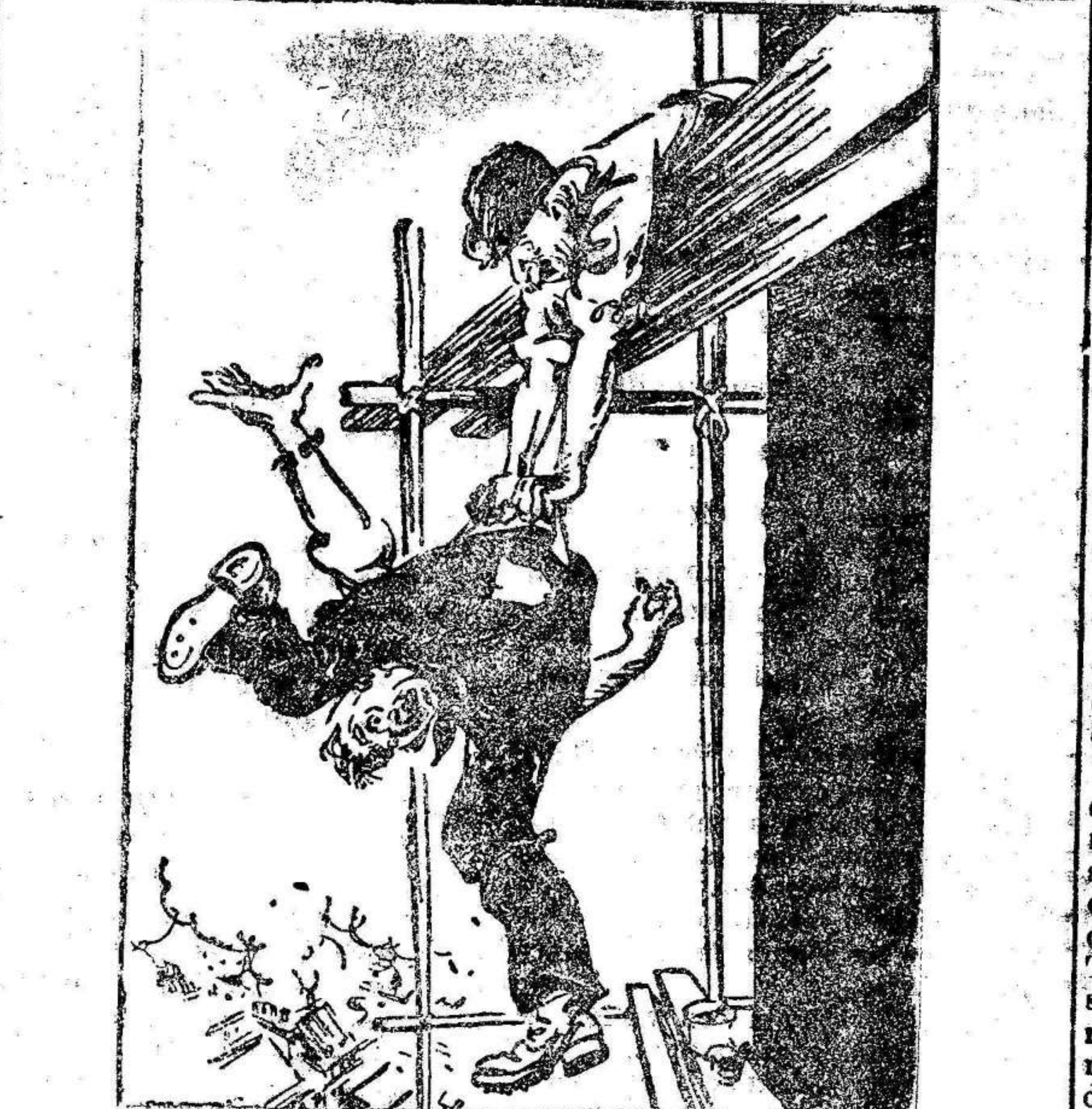
¡Caramba! Acaba de sonar el pito de las doce y no voy a tener más remedio que soltarte.