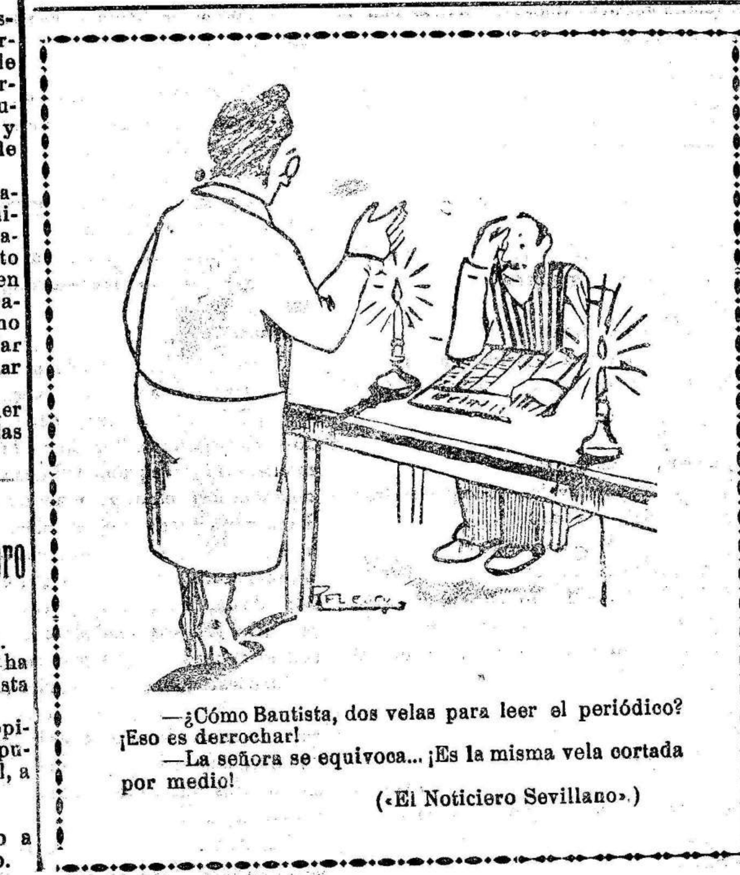
—¿Cómo Bantista, dos velas para leer el periódico? —Eso es derrochar! —La señora se equivoca... ¡Es la misma vela cortada por medio!

11, a las 11 n. Madrid.—Durante el día de hoy la madre del desventurado capitán Galán ha recibido innumerables testimonios de pésame por medio de tarjetas y telegramas.