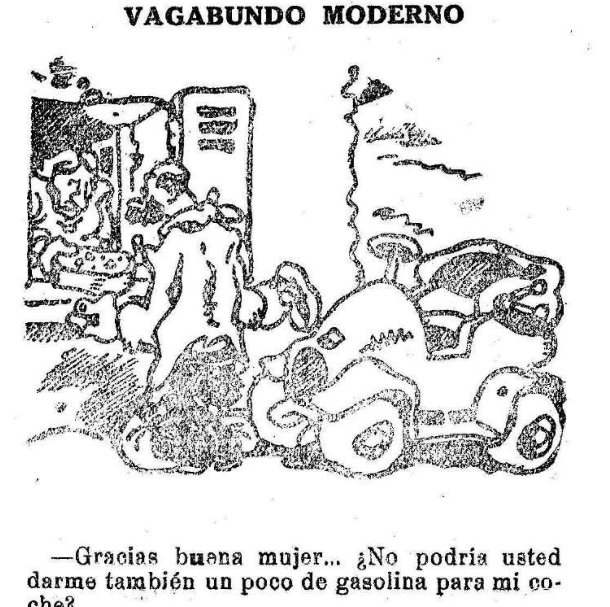
—Gracias buena mujer... ¿No podría usted darme también un poco de gasolina para mi coche?