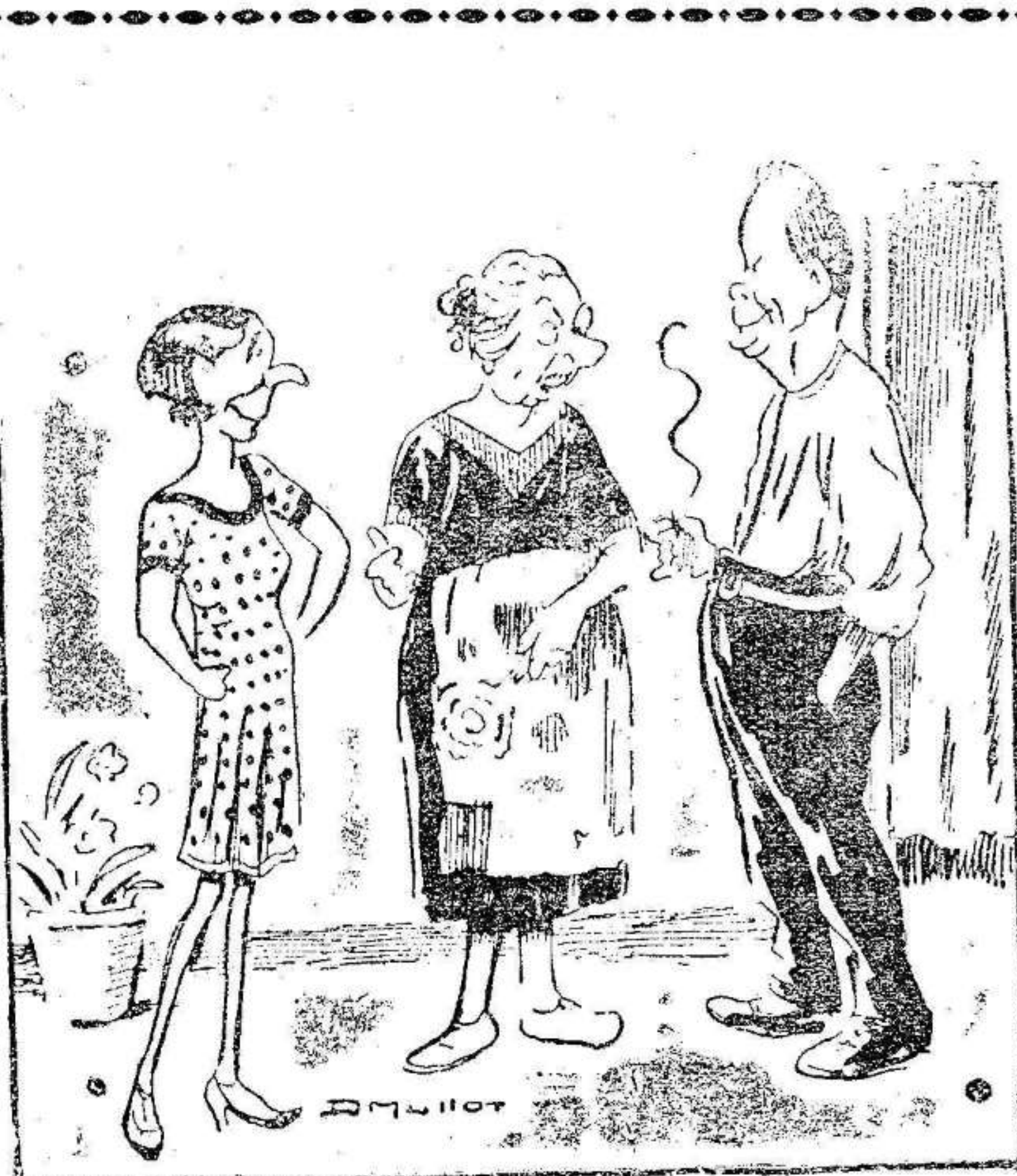
—¿Qué le parece a «uste» la moda de la falda larga «seña» Catalina? —Que ya podrá mi niña salir a la calle, porque parece que los hombres no han visto nunca pantorrillas.

Barcelona.—El miércoles sale de Barcelona con dirección al Norte para hacer la segunda etapa de su viaje en su carreta exposición, el caricaturista «Bon»