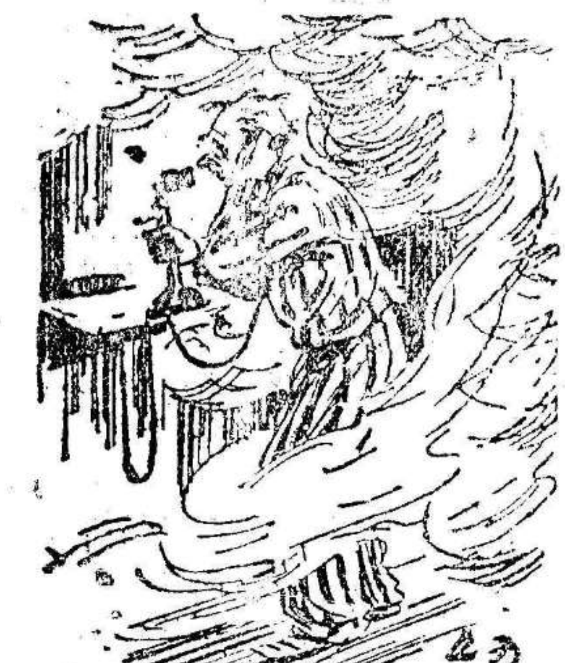
EL VECINO EMPAVORECIDO. — ¡Fuego! ¡Fuego! UNA VOZ.—¿Dónde? EL VECINO.— ¡Aquí!