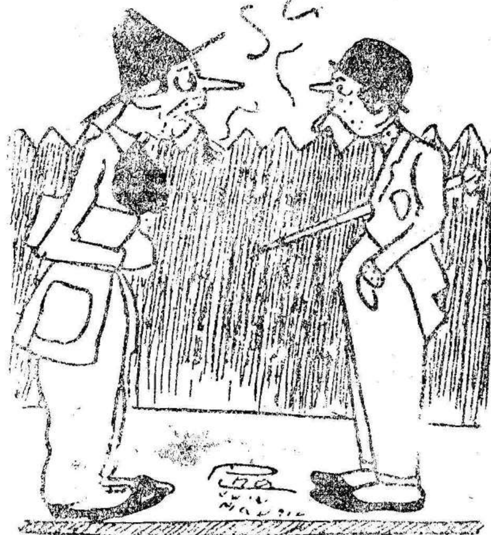
—¡Chico, tanto tiempo sin verte; creí que te habías muerto!

Finalmente se acordó reunirse nuevamente el próximo viernes para ultimar la confección de la candidatura que ha de ser propuesta a la Asamblea.