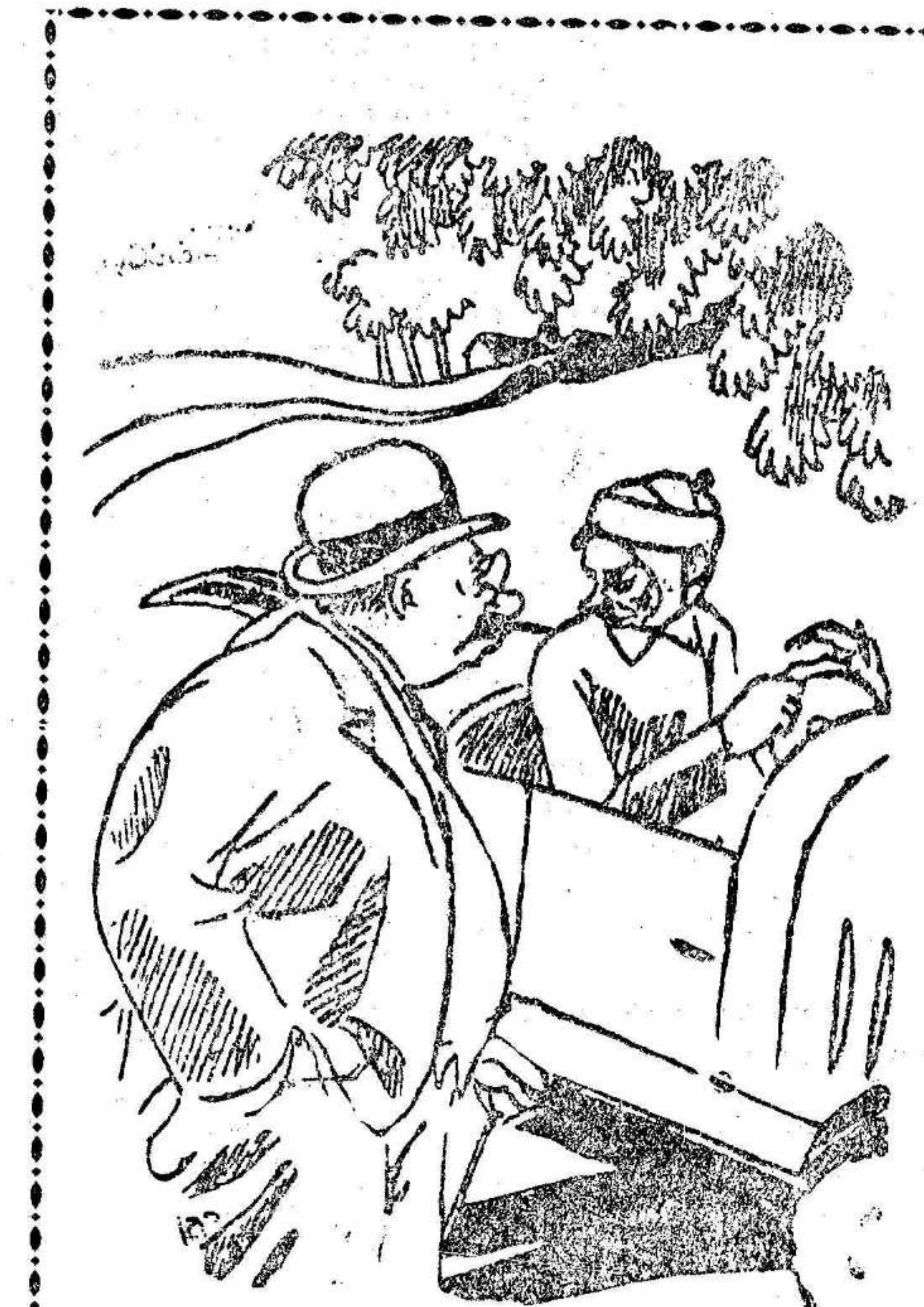
—Concretamente: ¿qué es lo que más le ha chocado a usted durante la excursión? —Pues... ya lo ve usted: otro coche.

El Ayuntamiento pidió que se llevara a la cárcel a los autores del desfalco, pero el alcalde aconsejó, por entenderlo más conveniente, seguir los trámites administrativos.