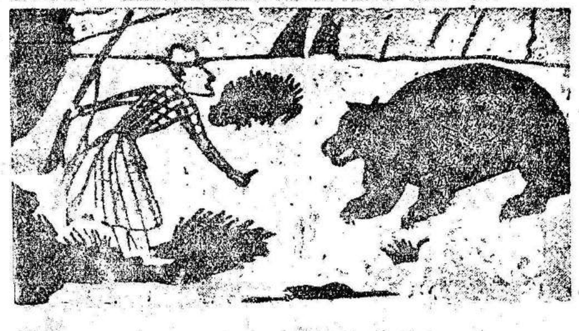
— ¡No! ¡No! Yo vine únicamente a cazar conejos...

La cuestión estudiantil. También se sabe que el ministro de Instrucción pública informó al Consejo del estado del asunto referente a las Universidades.