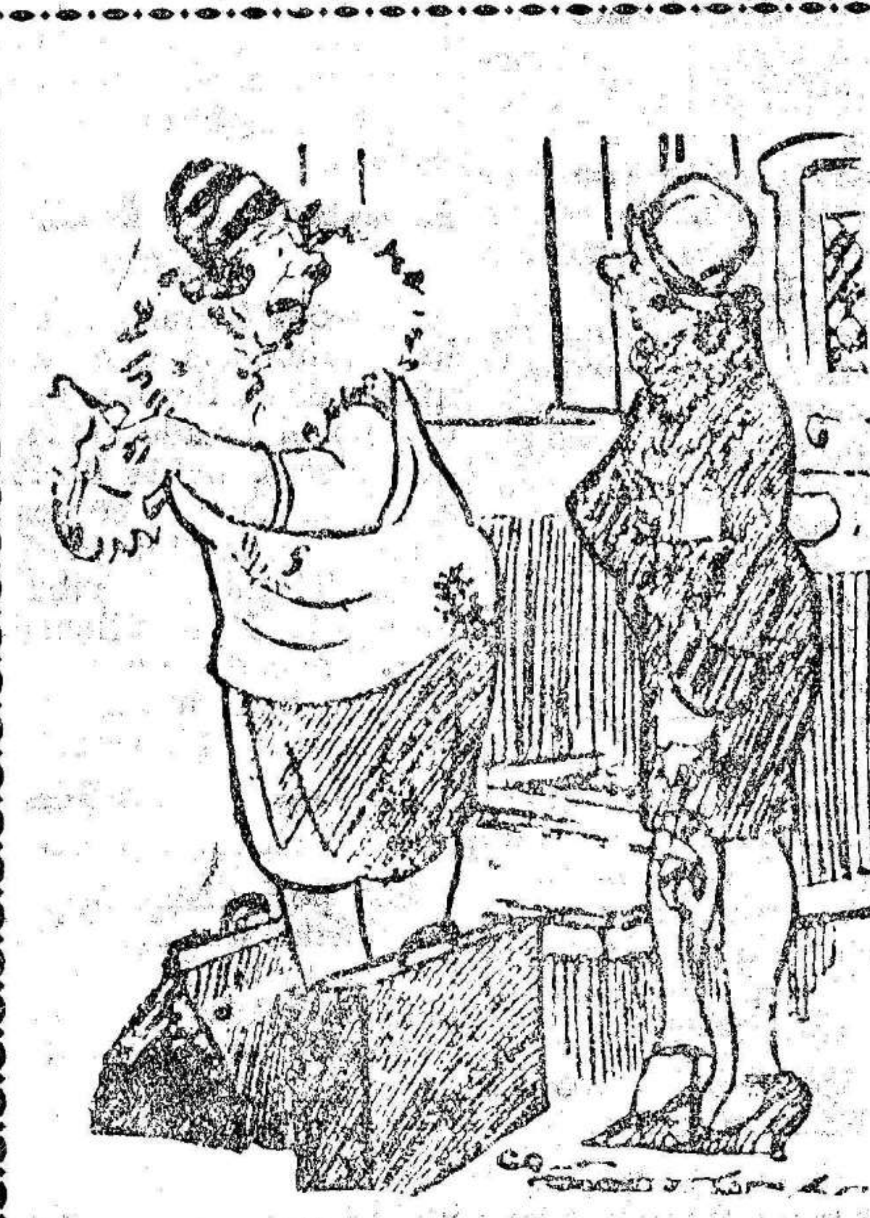
—¿Se va de viaje? ¿Irá usted en tren? —No, me marea el tren; voy siempre por mar.