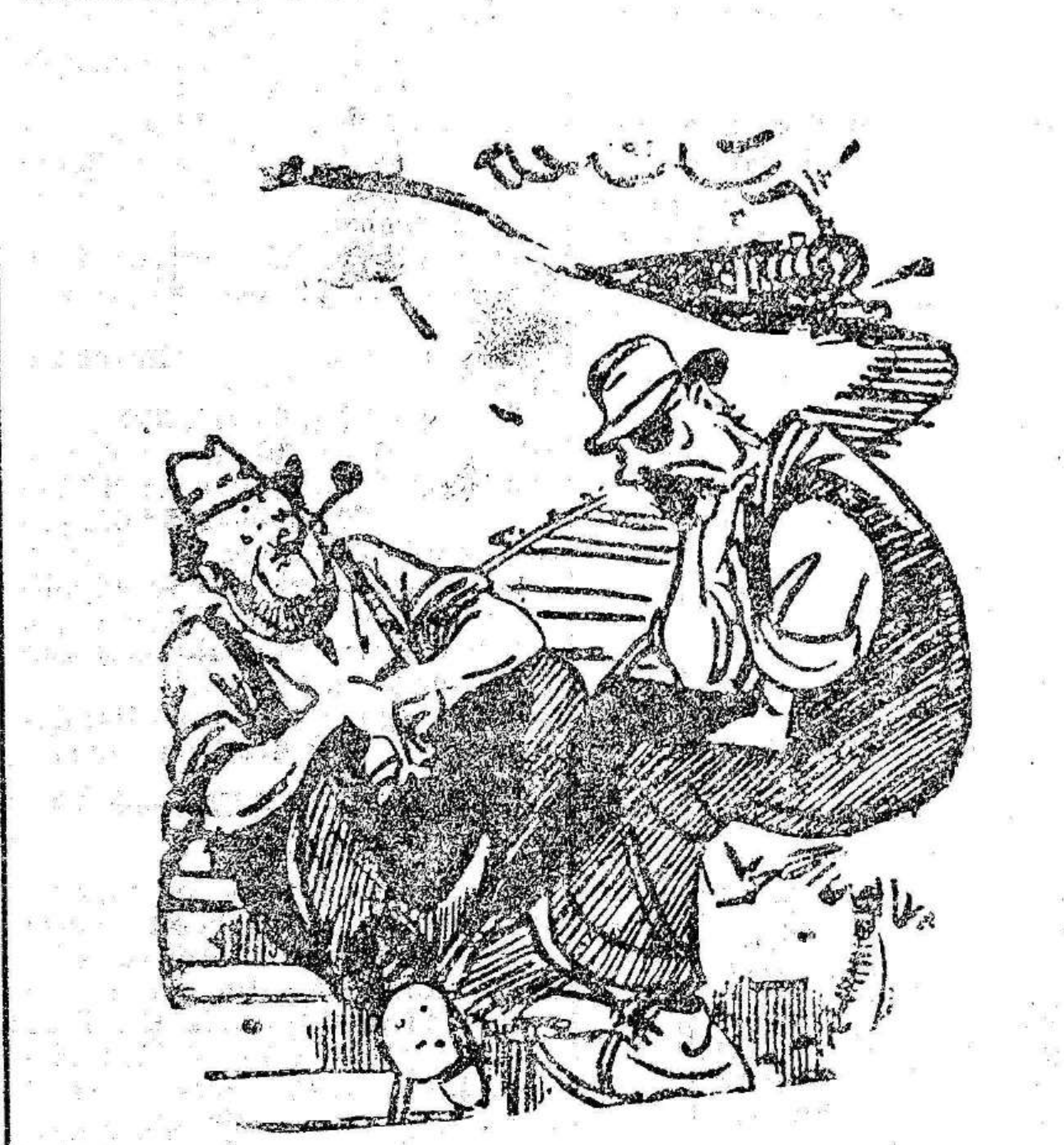
—Me han dicho que deseas que te incineren cuando muera. —Sí; pero he cambiado de opinión desde que se me meti ron unas cenizas en este ojo.

Suscribese a EL LIBERAL 2 pesetas al mes