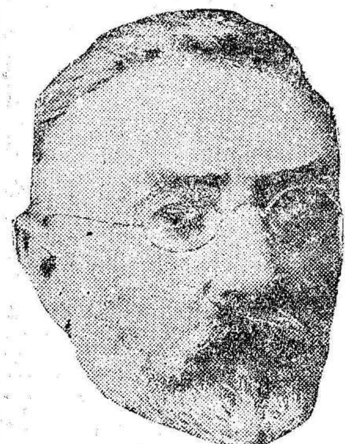
D. Miguel de Unamuno, a quien el régimen dictatorial separó de su augusta magistratura, valiéndose de innobles y ridículas artes