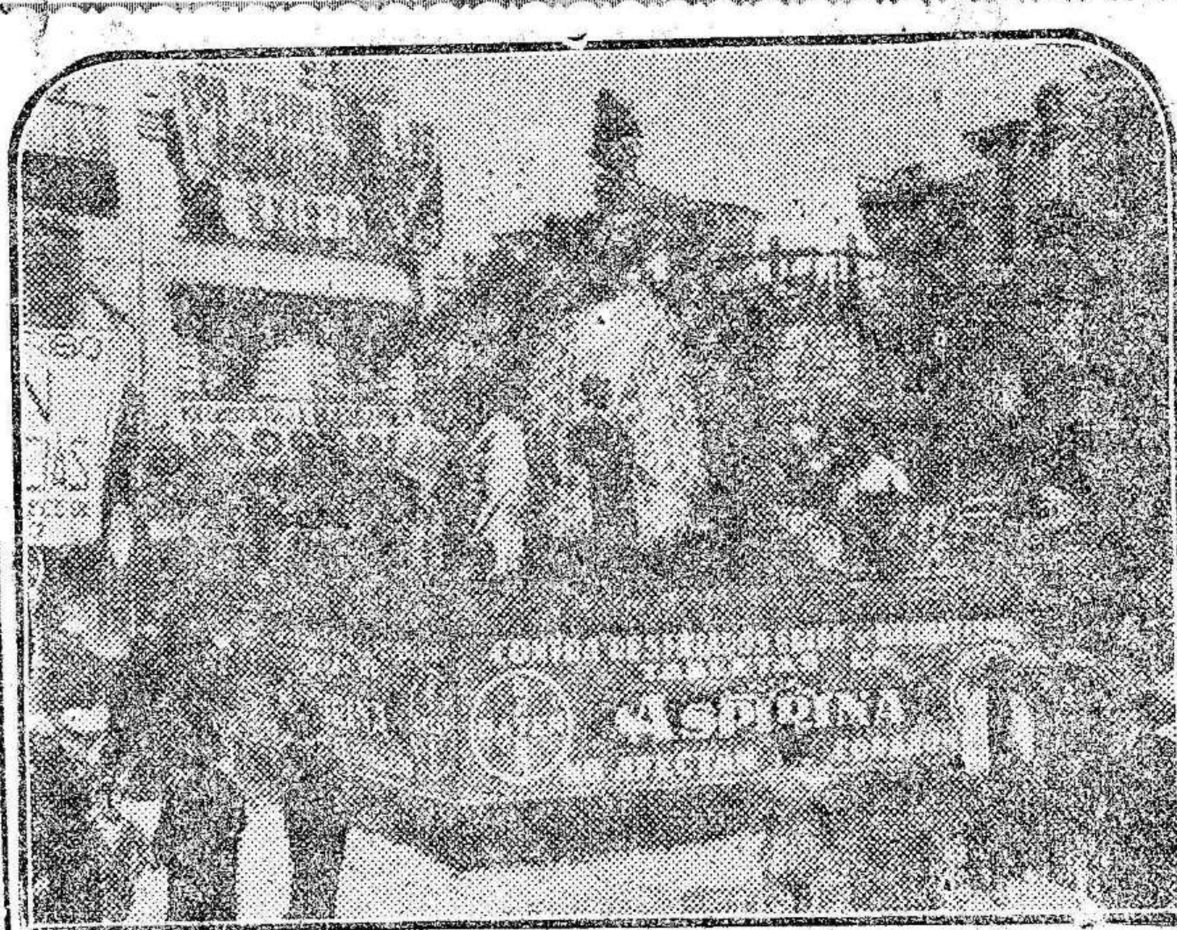
'Falla' presentada por la Sociedad La Química Comercial y Farmacéutica para propaganda del producto Aspirina de la Casa Bayer, cuyas tabletas disfrutan de universal renombre por su eficacia contra resfriados, gripe y reumatismo, sin que afecten al corazón ni produzcan trastornos de ninguna especie.