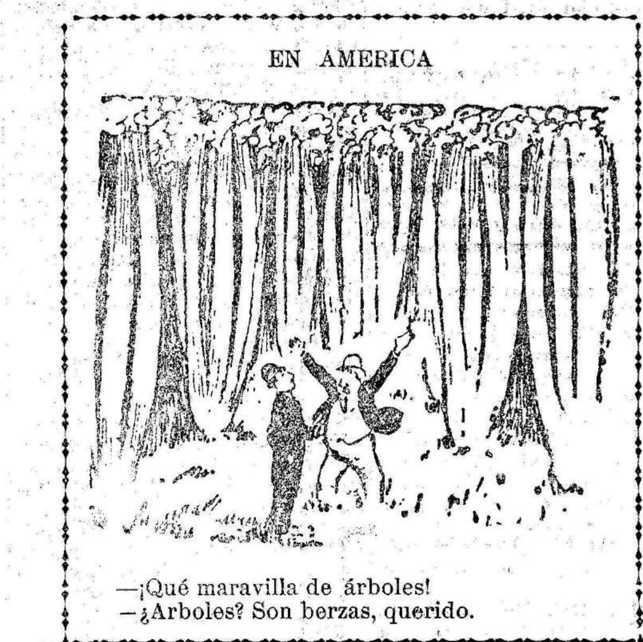
—¡Qué maravilla de árboles! —¿Arboles? Son berzas, querido.

Suscribase a EL LIBERAL 2 pesetas al mes