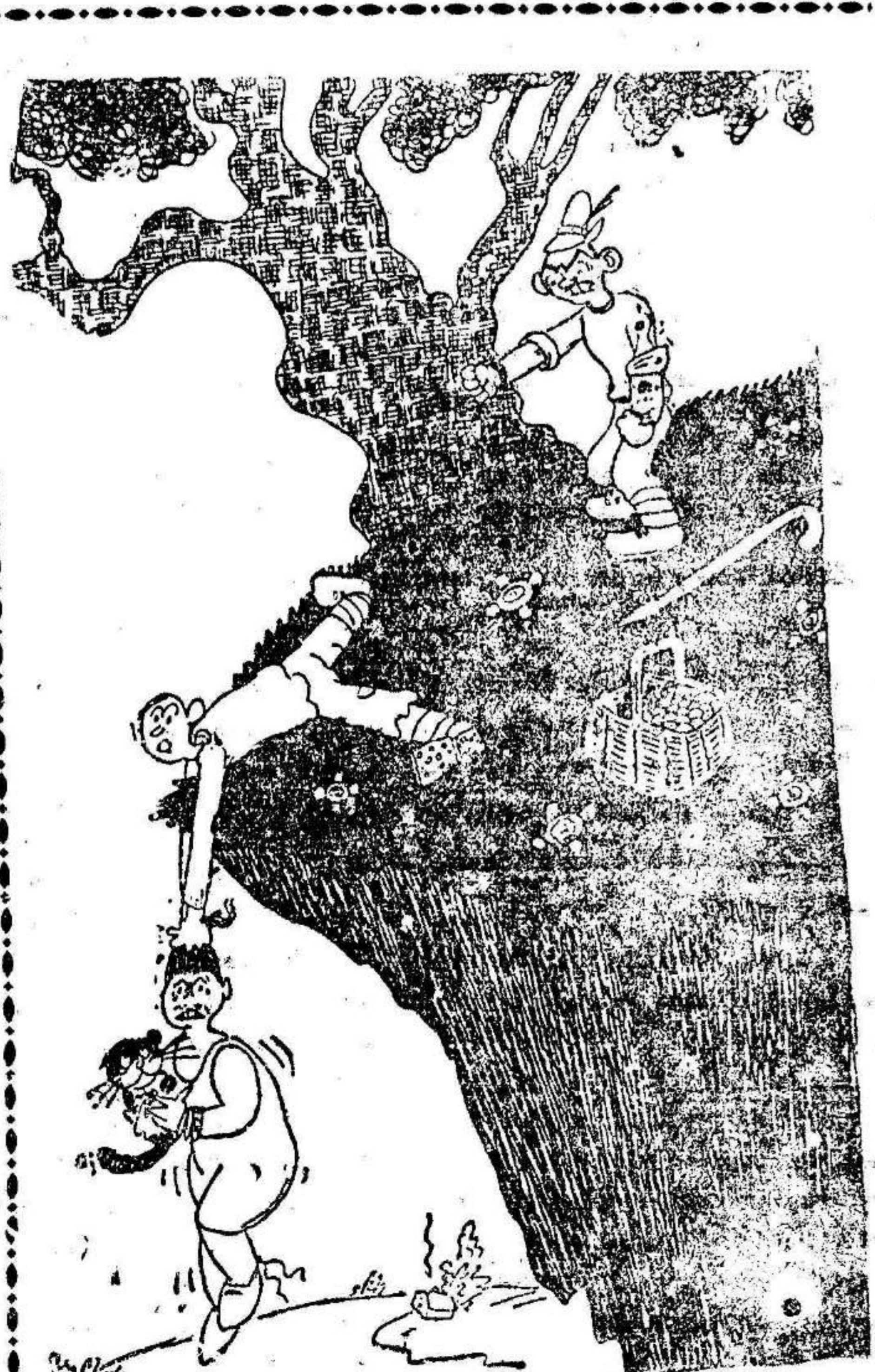
—Oiga! No sea usted asesino, no le tire de los pelos a mi suegra. ¡Súetela!

En la misma sugiere a la Academia la idea de celebrar todos