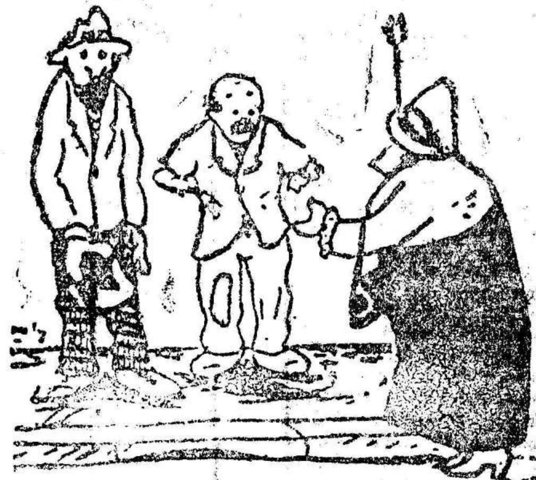
—¡Usted pase! ¡Pero su compañero podría trabar! —¡Mi buena señora: no puedo pasarme sin él; es el que me rasca...

estuvo en la Presidencia recibiendo su anunciada audiencia diplomática hasta poco antes de las nueve de la noche. A dicha recibió a los periodistas a los que informaron de las visitas recibidas por la tarde.