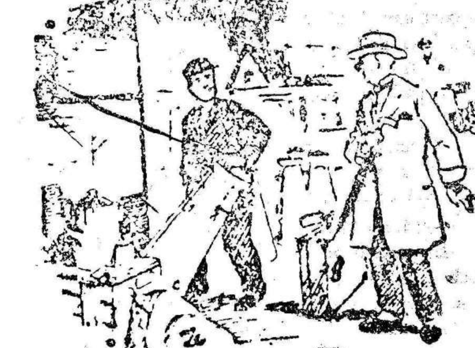
EL PASAJERO (irritado).—¿Para qué sirven esos indicadores de trenes, siempre llegan con retraso?

Nueva York.—Los partidarios del candidato demócrata, señor Smith, se han quejado ante el juez de que sus enemigos realizan una propaganda anticatólica por correo para combatir su elección. El juez les ha citado la decisión adoptada por el Tribunal Supremo en un caso similar, al negarse el departamento de Correos a rechazar libros y folletos de propaganda atacando a la Inmaculada Concepción, la sentencia dice: «Si la religión cristiana es divina, resistirá a todos los ataques; pero sea o no divina, la Constitución permite discutirla en todos sus puntos. Del correo sólo pueden excluirse materias ofensivas o lascivas.» Los amigos del Sr. Smith alegan que la sentencia no es aplicable a este caso, porque la queja no es contra los ataques a la religión, sino por las críticas injustas contra el campeón demócrata.