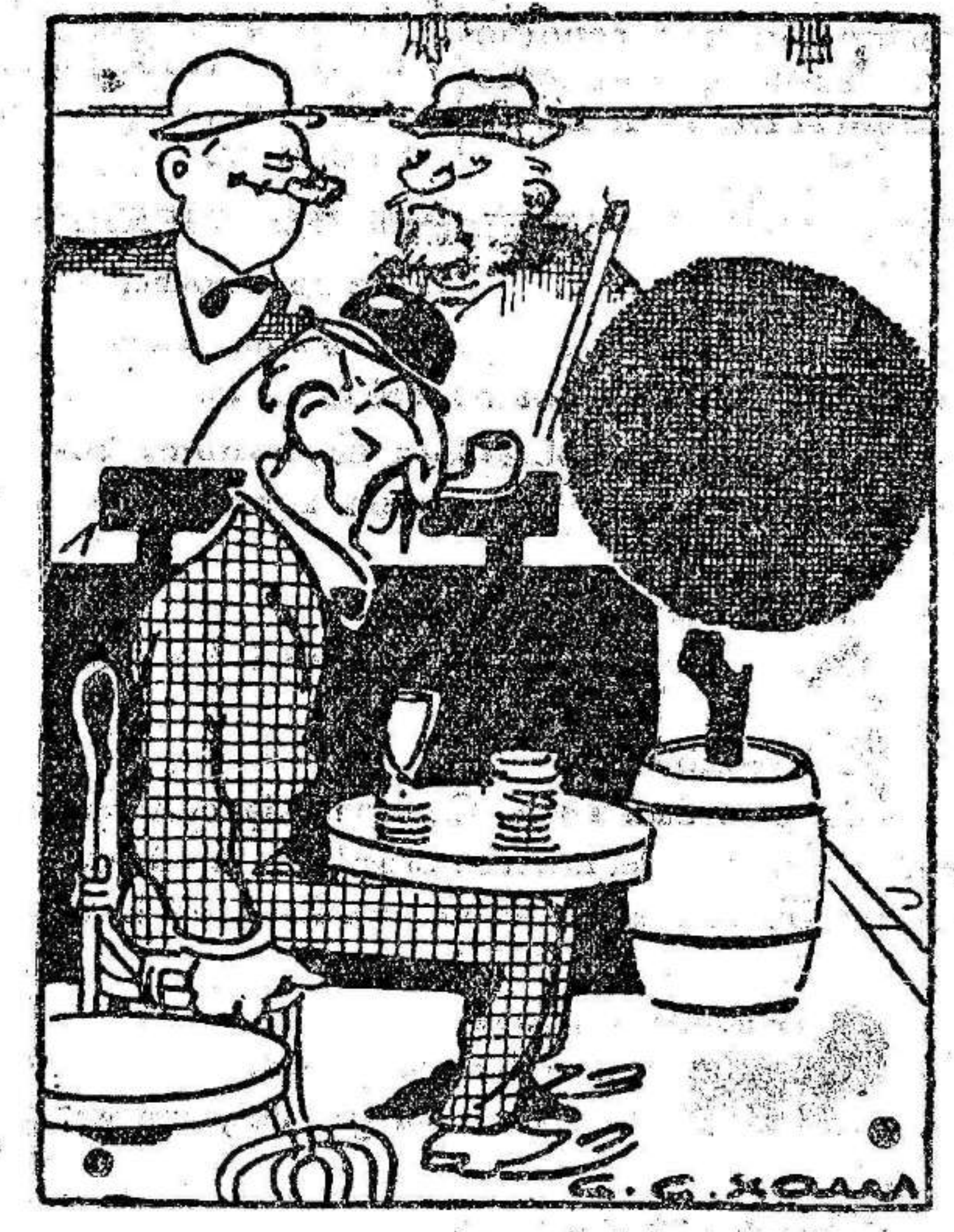
—Mira cómo toma el aire... —Sería más apropiado decir que lo bebe.

Madrid.—En el mes de Junio se celebrará en París la exposición de la Habitación y del Progreso social. En dicho certamen figurará una colección de periódicos y libros sociales españoles.