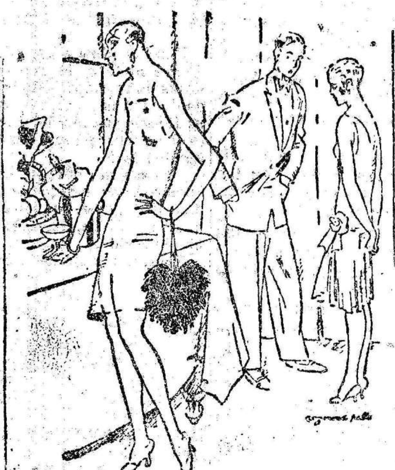
—¿Por qué frecuenta usted una amiga de tan mala pinta, señorita? —¡No puedo menos!... es mi maridá.