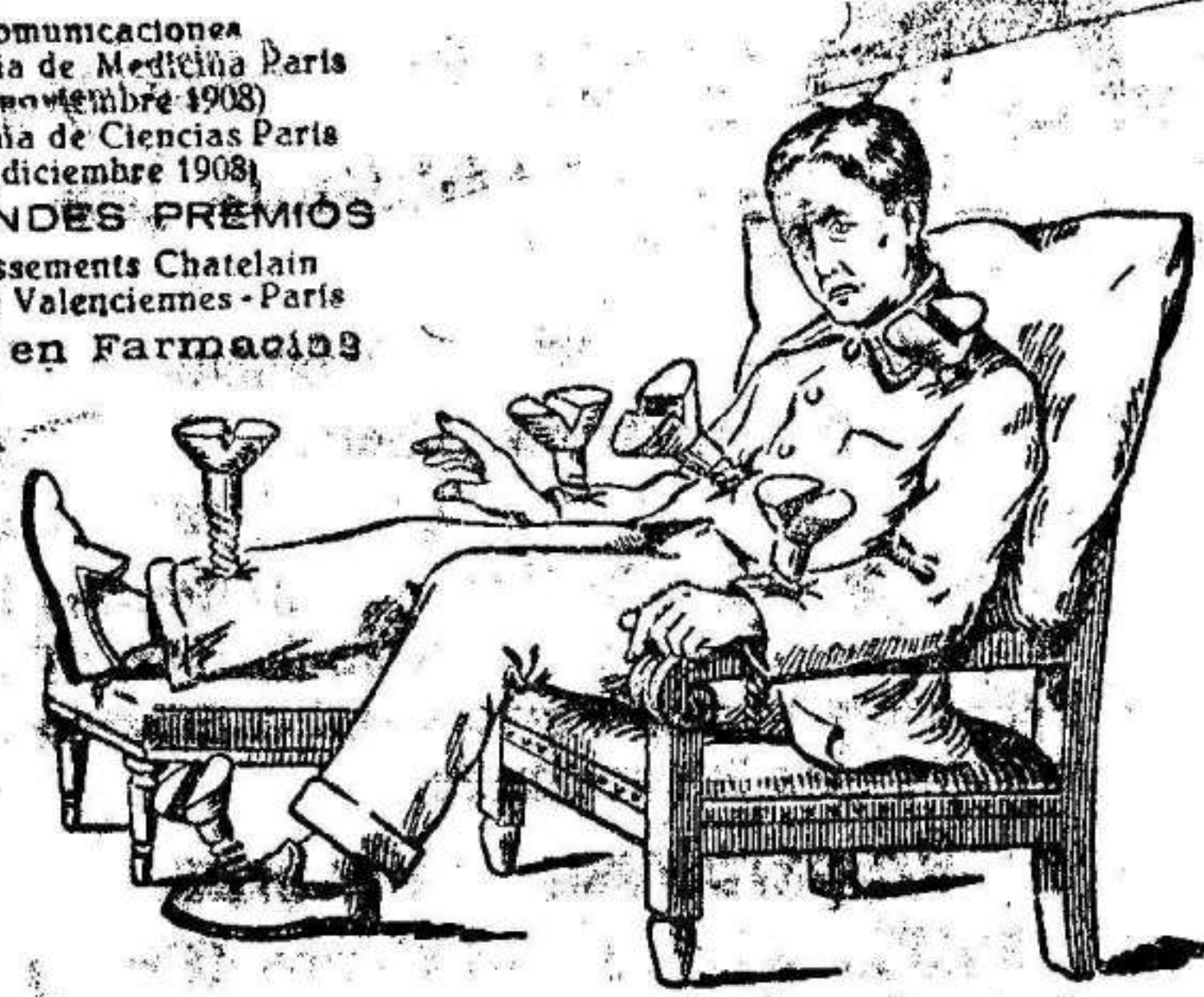
El martirio del reumático