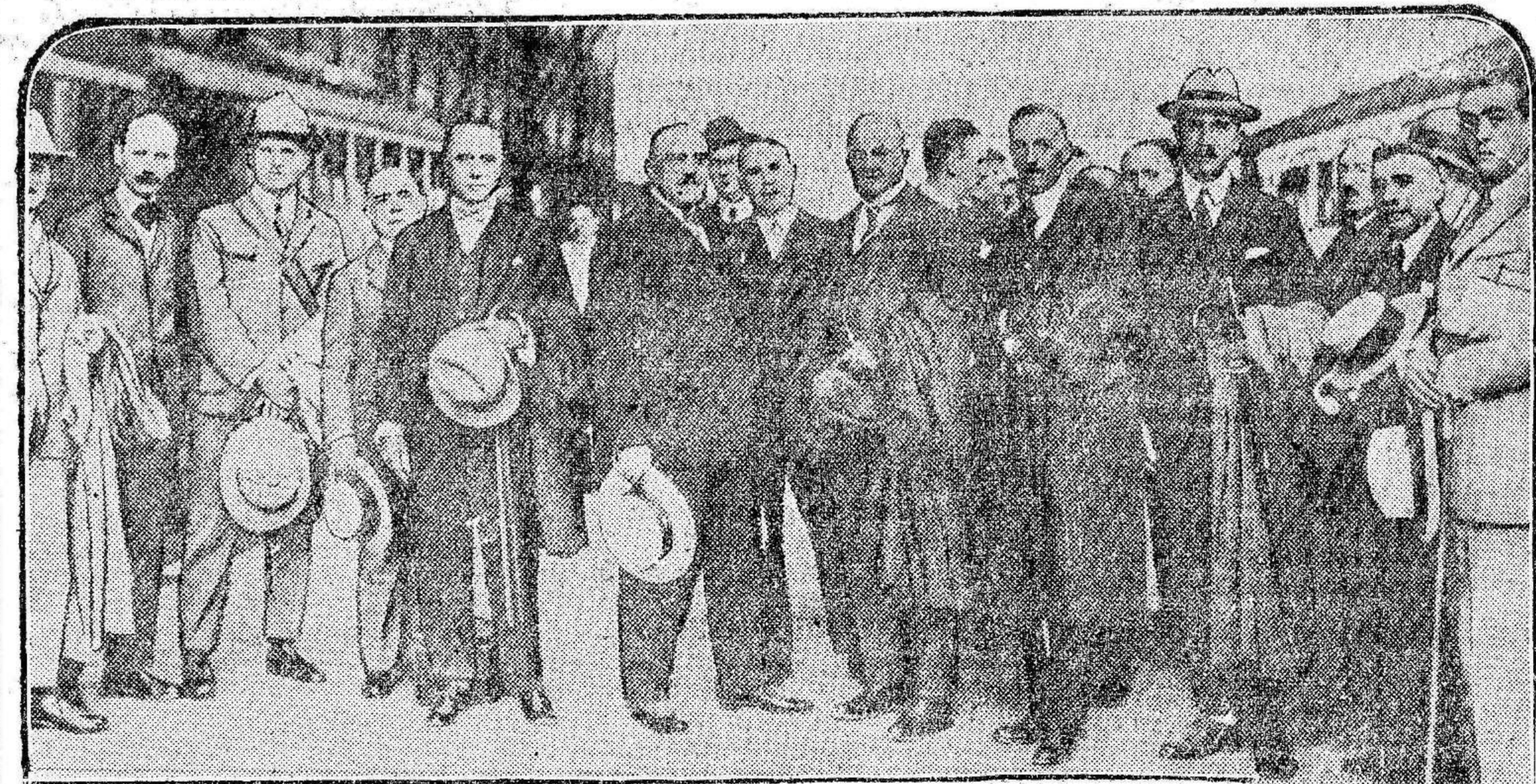
Llegada a Madrid de la Comisión sanitaria de la Sociedad de Naciones, que ha venido a España con el propósito de estudiar el paludismo en todas sus manifestaciones.