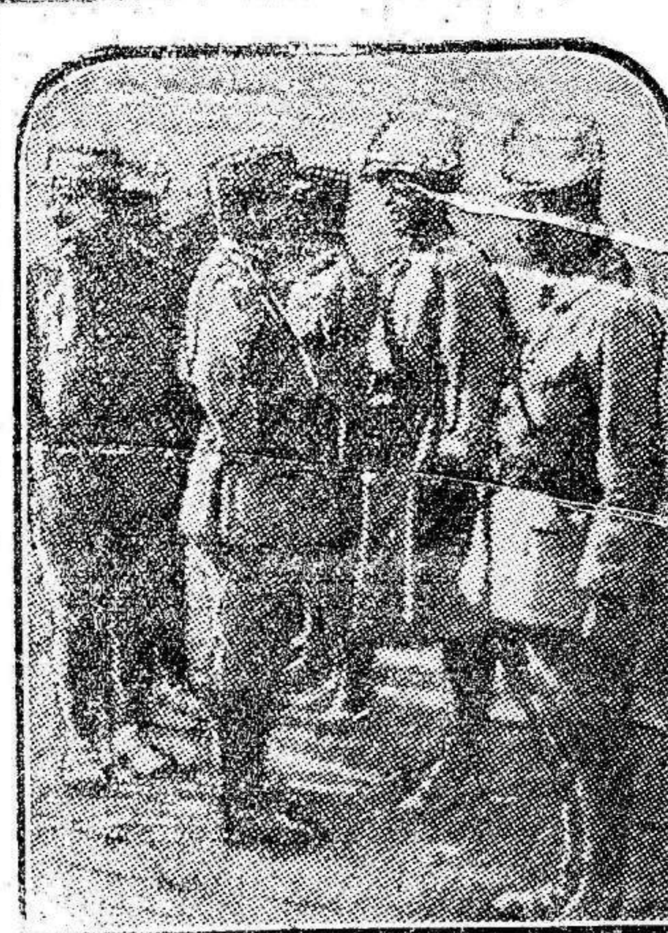
El general Naulin felicita a los soldados de la Legión extranjera, que ha intervenido de un modo brillantísimo en las operaciones realizadas por el Ejército francés últimamente en Marruecos