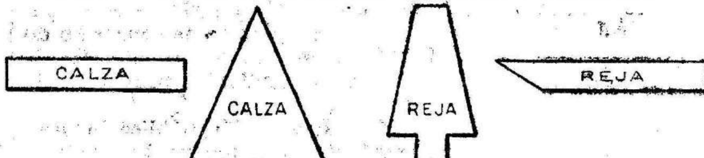
RECORTES Y PLETINAS PARA FABRICACION DE HERRAJURAS.